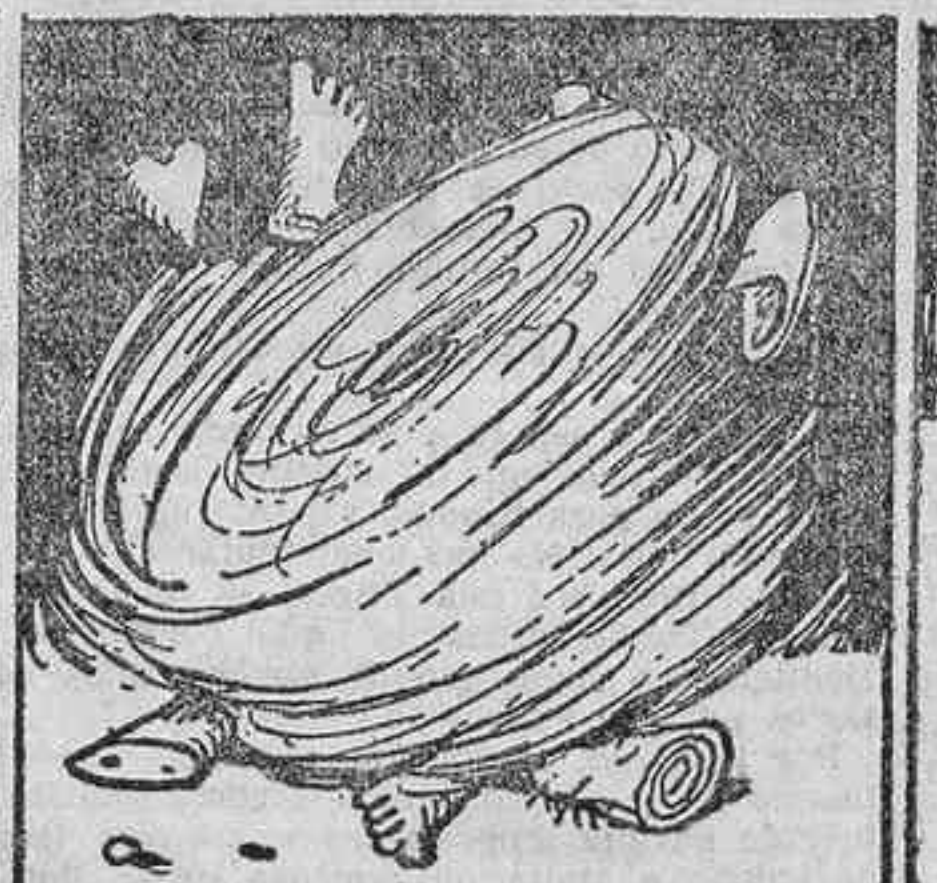
La lucha continúa en un feroz cuerpo a cuerpo.