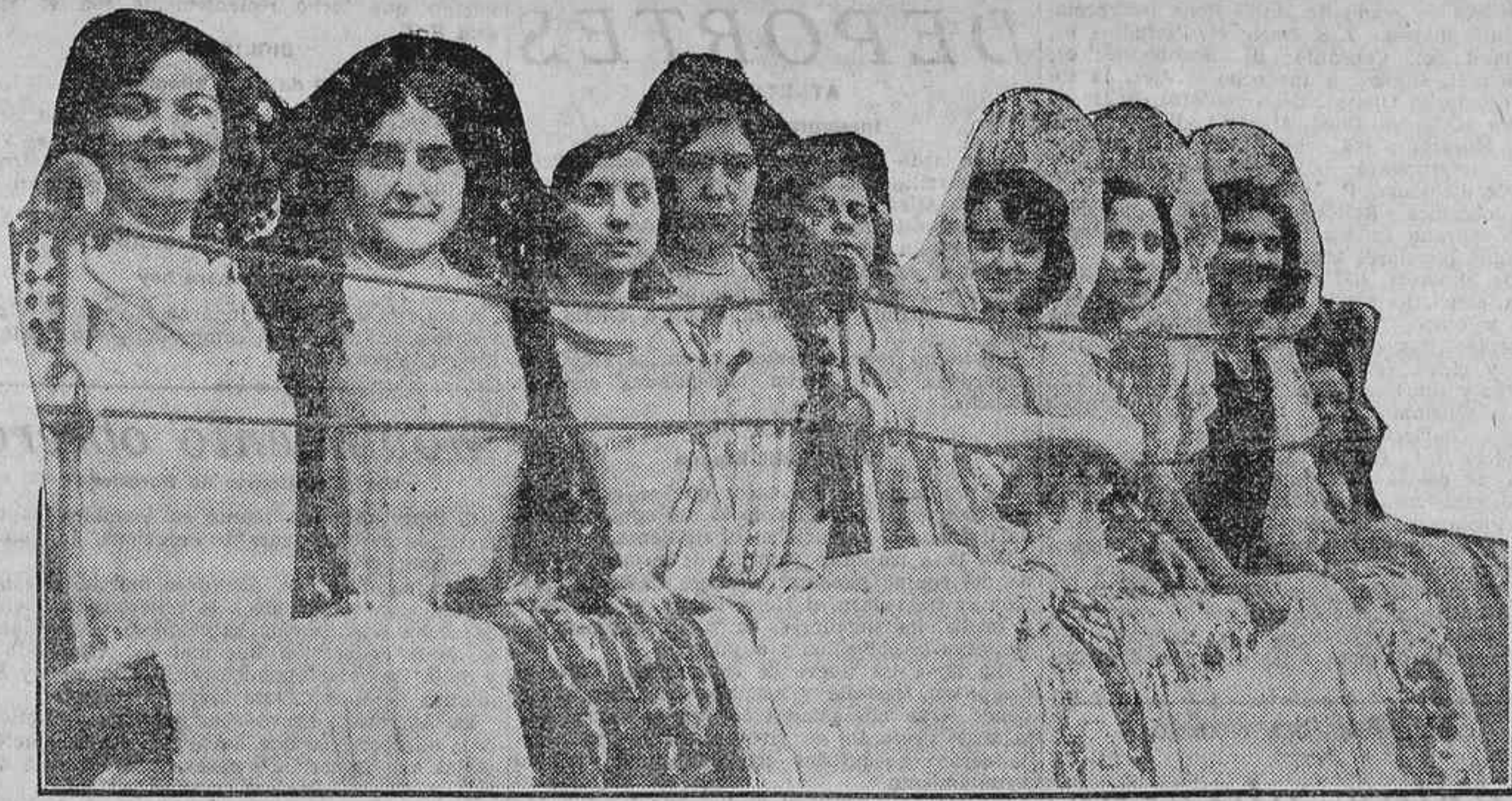
VIENDO LOS TOROS DESDE LA BARRERA—UNA BARRERA COMO PARA «TOMAR EL OLIVO»—EN LA BECERRADA DE LOS CAÑEROS CELEBRADA AYER EN LA PLAZA DE MADRID