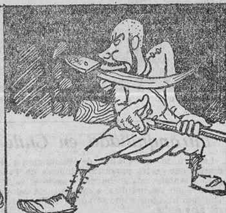
La vista de lince del montañés se dibujarse en la obscuridad una silueta: el enemigo.