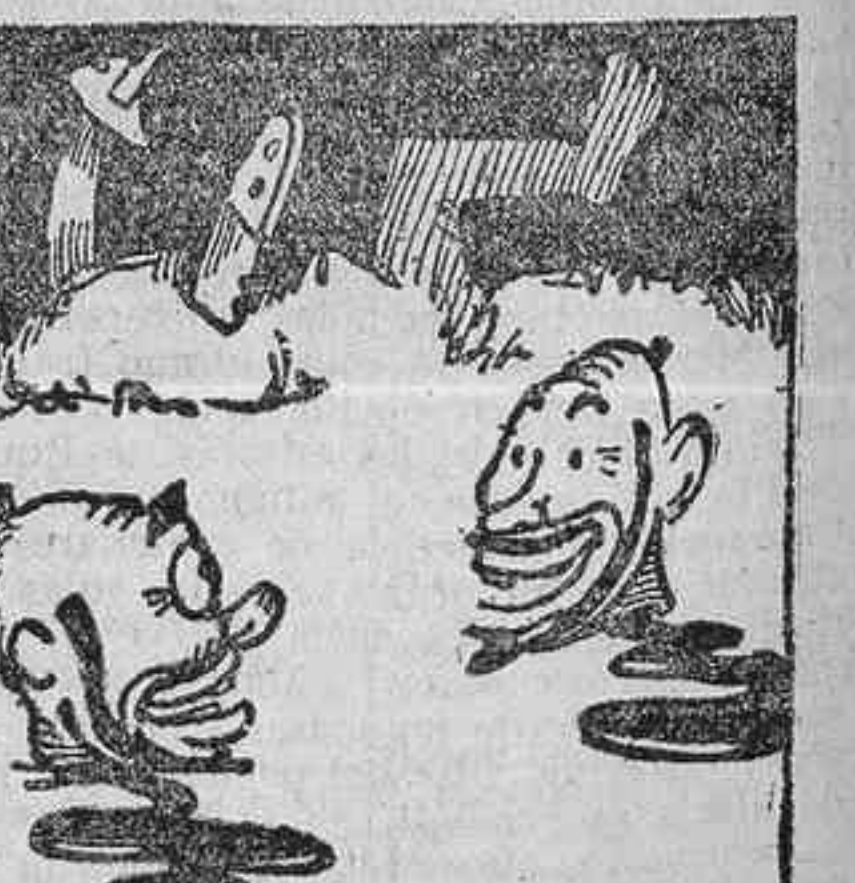
Grande fue la alegría de los bellosos hermanos al reconocerse.