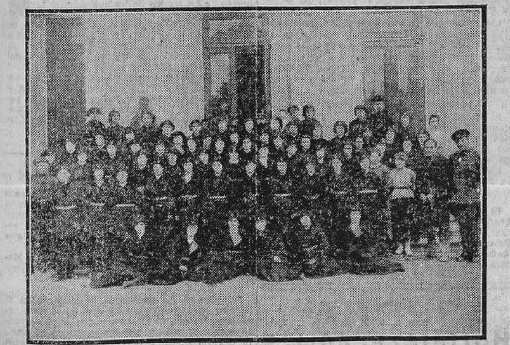
LA POLICIA DE MUJERES DEL GOBIERNO DE LOS SOVIETS QUE EJERCE SUS FUNCIONES EN LENINGRADO (ANTES PETROGRADO Y MAS ANTERIORMENTE PETERSBURGO)

Ayer apareció su cadáver flotando en el río Este, cerca del pueblo de Almendra, y al hacer la autopsia, los médicos comprobaron que era inexacta la imputación deshonrosa que movió a la joven a tan fatal resolución.