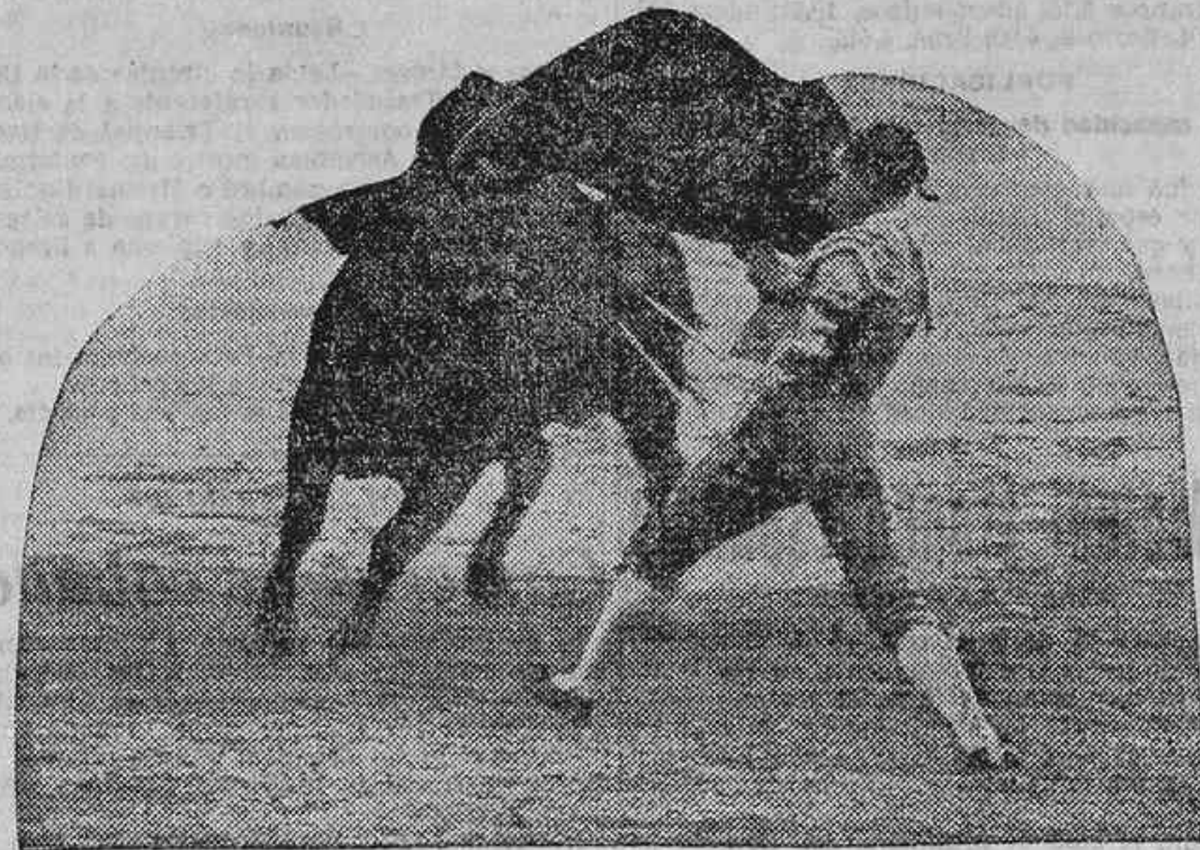
VALENCIA II PASANDO DE MULETA

lidiador, que es, al fin y a la postre, la que les ha elevado a los primeros puestos, o la que les ha hecho descender a las obscuridades del olvido. Y la historia de Valencia II está llena de esos triunfos contra el público que le persigue, que se ensaña con él, que le niega el pan y le sal, y que, por último, tiene que rendirse ante un arranque de soberbia y de valor de Victoria, que es uno de los toreros de más valor, seco y sin trampa, de los que pisan los ruedos es paños.