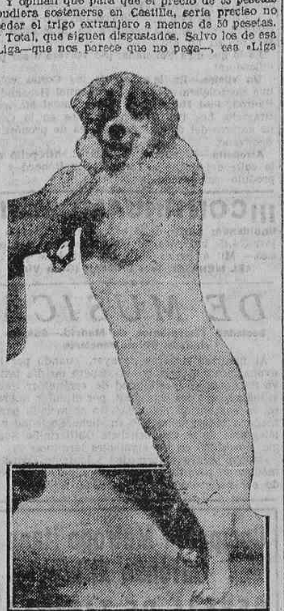
EN LA EXPOSICION CANINA. — Hermoso ejemplar de perro de los Pirineos

to a 51 pesetas, ¿a qué precio se va a pagar en origen el cardeal de Casallat? No podrá ser a mucho más de 44 o 45 pesetas, dada la diferencia de precio siempre existente entre ambas clases. Y opinan que para que el precio de 53 pesetas pudiera sostenerse en Castilla, sería preciso no ceder el trigo extranjero a menos de 50 pesetas. Total, que siguen disgustados. Salvo los de esa Liga—que nos parece que no paga—, es «Liga