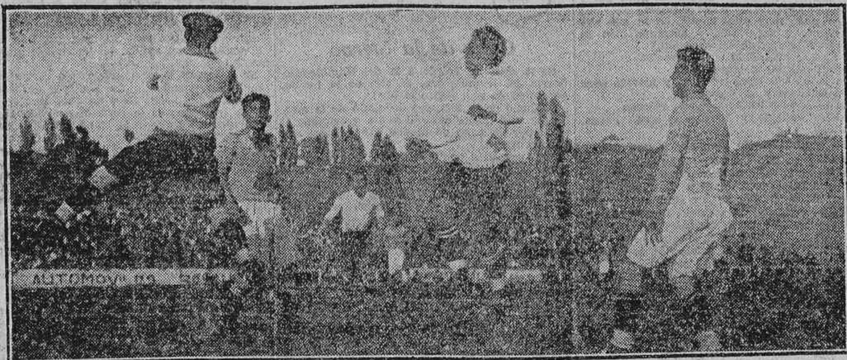
UN INTERESANTE MOMENTO DEL PARTIDO JUGADO AYER