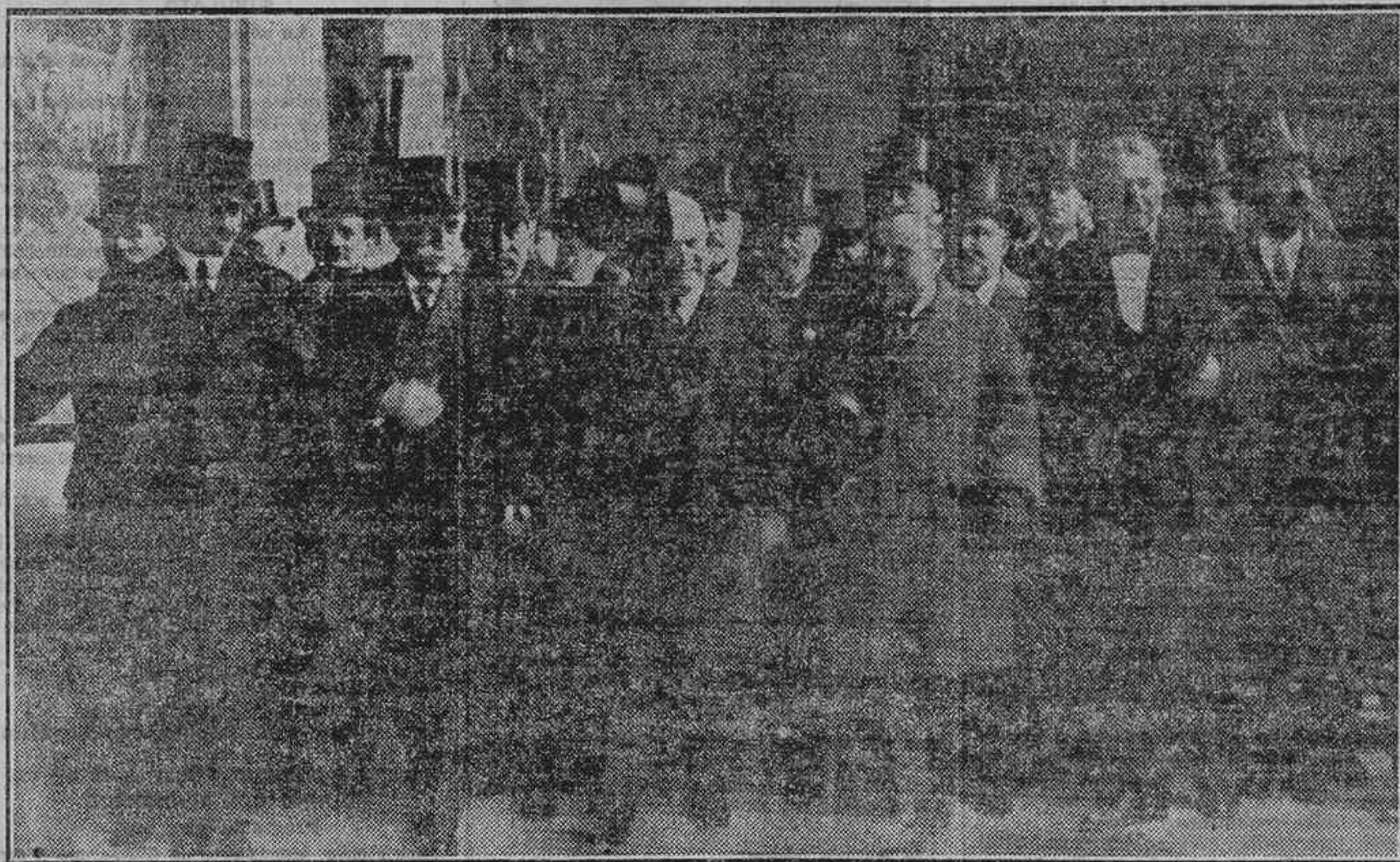
EN PARIS.—El presidente de la República francesa saliendo, con el Gobierno, de la Exposición de Artes decorativas, después del acto inaugural

La ceremonia inaugural de la Exposición de Arte decorativo moderno, en París, ha revestido una gran importancia. Es necesario remontarse en el pasado a los ya lejanos tiempos en que nuestros abuelos y nuestros padres presenciaban la inauguración de la Exposición Universal, para encontrar un acontecimiento análogo.