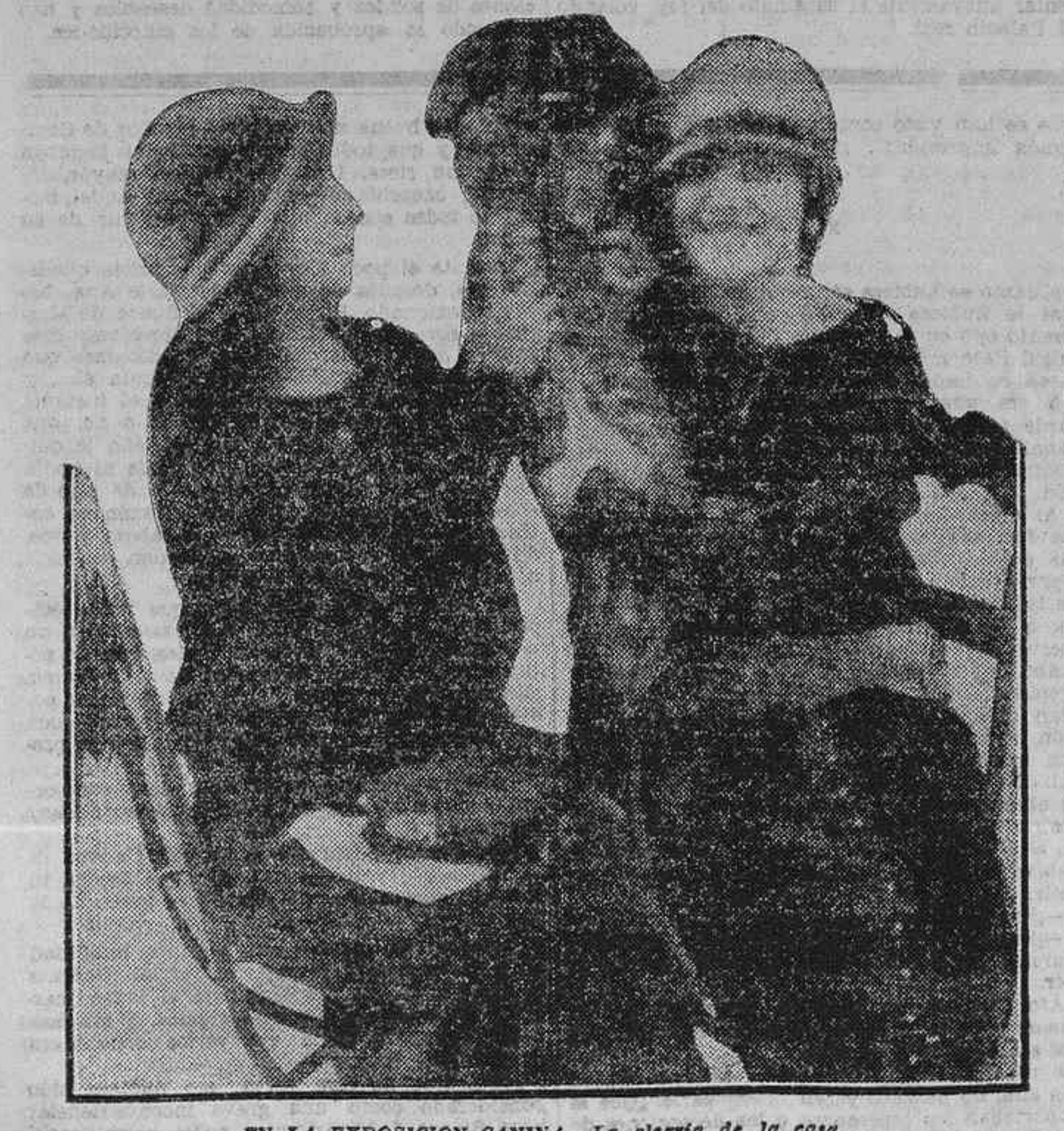
EN LA EXPOSICION CANINA.—La alegría de la casa