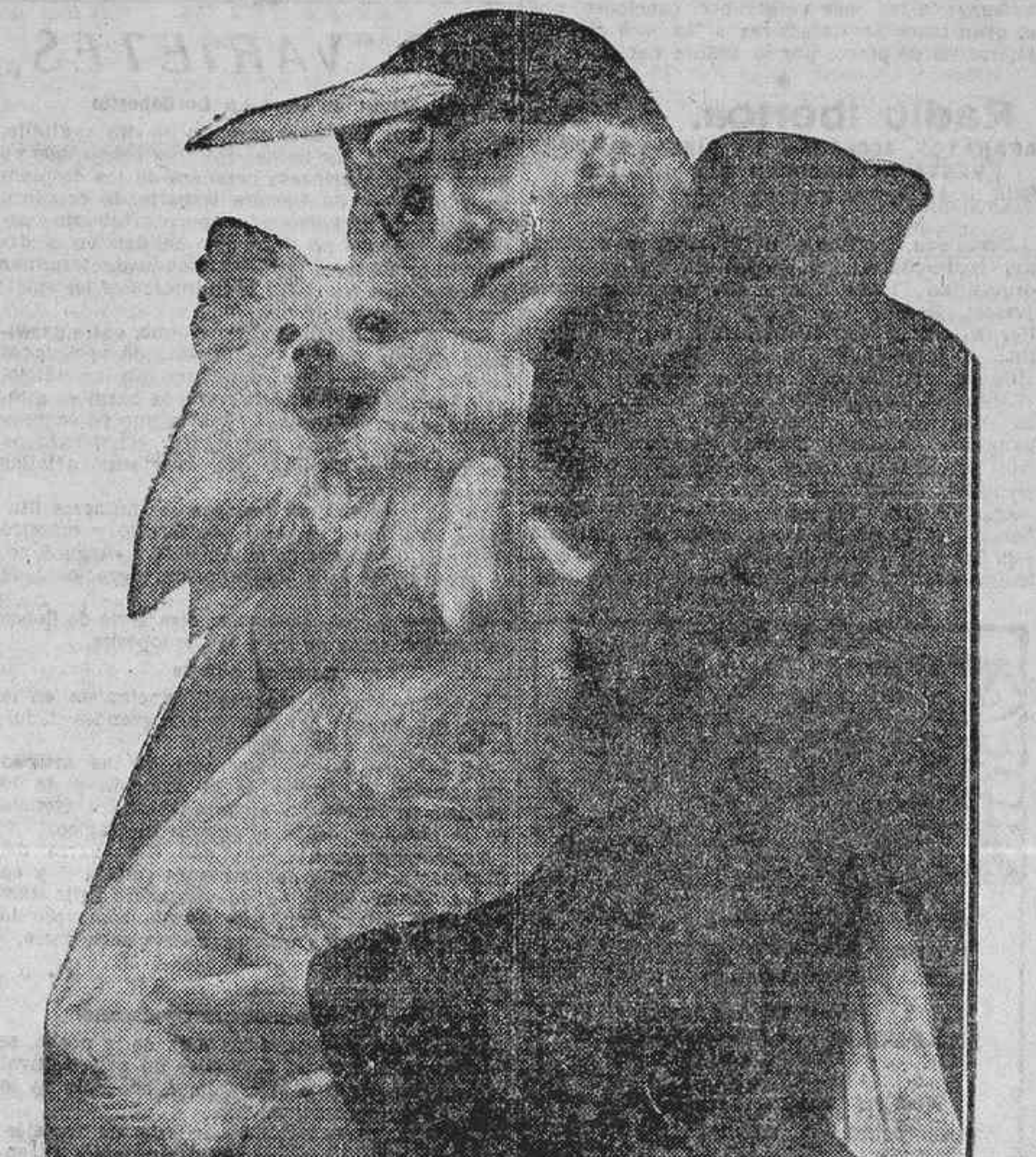
LA BELLISIMA TIPLE MATILDE REVENGA, QUE ESTA NOCHE CANTARÁ «LA BOME» EN EL TEATRO REAL EN UNION DE FLETA