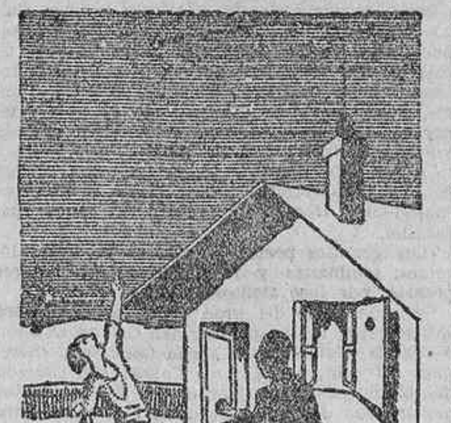
Mira, una estrella errante... Y todavía me reprochas que en este rincón no hay distracciones...