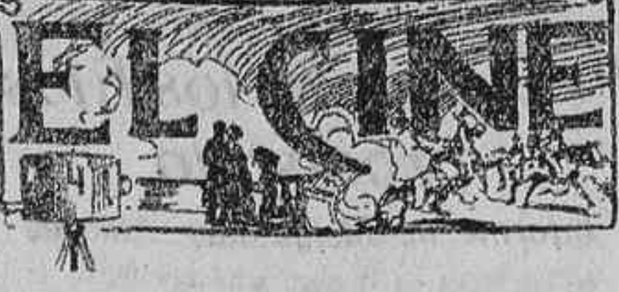
Un nuevo «film» de Raquel Meller

En Madrid, la máxima de ayer ha sido de 11,6 grados, y la mínima de 4,9.