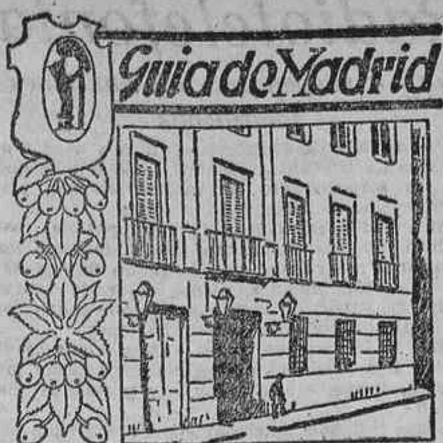
Calle de Santa Isabel

En el reinado de Felipe III quedó esa institución dedicada exclusivamente a colegio de niñas, y en 1738 se formaron las nuevas constituciones aprobadas por Felipe V, en las cuales estableció que en la admisión de colegialas se preferiese entre las huérfanas a las hijas de los empleados de la Casa real, del Ejército y del Estado; pero pueden admitirse, se admiten, pensionistas, si sus padres o parientes satisficen los gastos de manutención. El principal objeto de este establecimiento, la enseñanza, es hoy lo mismo que en su origen.