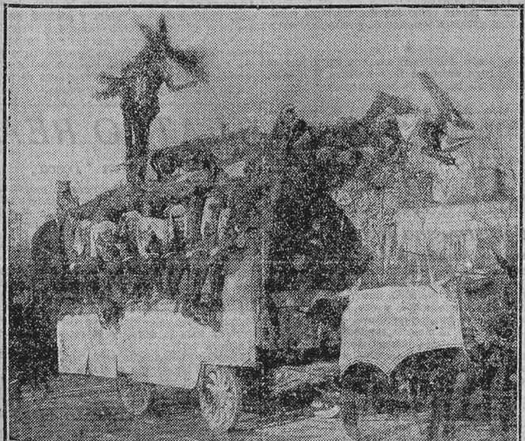
EL CARNAVAL EN MADRID.—MERIENDA DE NEGROS, SEGUNDO PREMIO DE CARROZAS