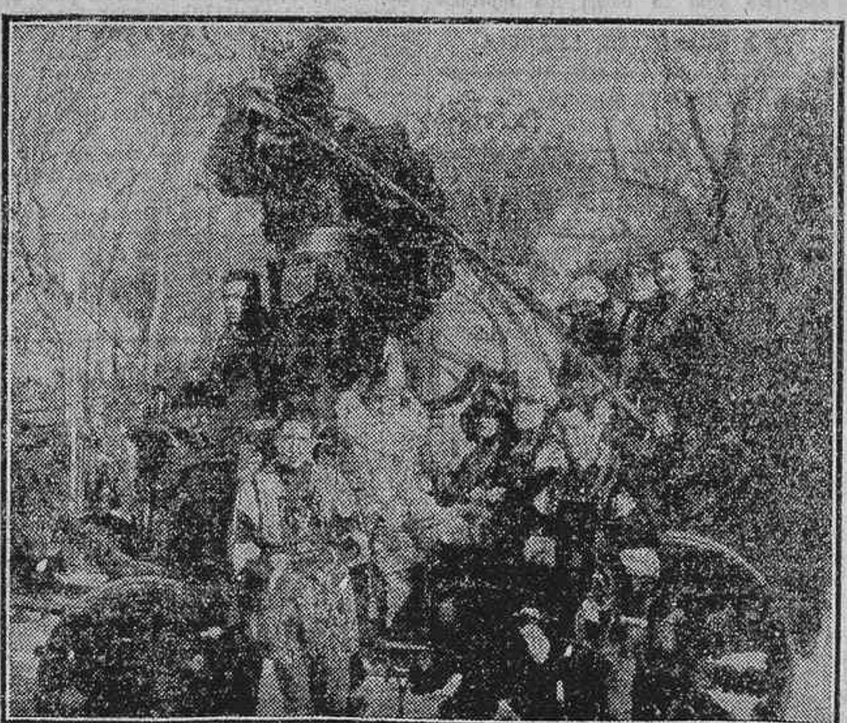
EL CARNAVAL EN MADRID.—YA QUE NOS LLEVA EL DIABLO..., PRIMER PREMIO DE COCHES