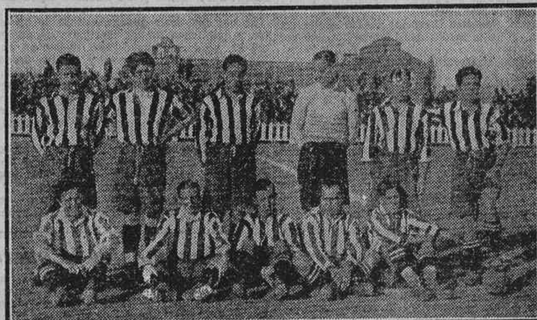
EL ATHLETIC CLUB, DE MADRID, CAMPEON DE LA REGION CENTRO

Figuraban inscriptos para esta prueba 114 corredores, de los que tomaron la salida, a las once de la mañana, 94, logrando terminar la carrera y clasificarse 84.