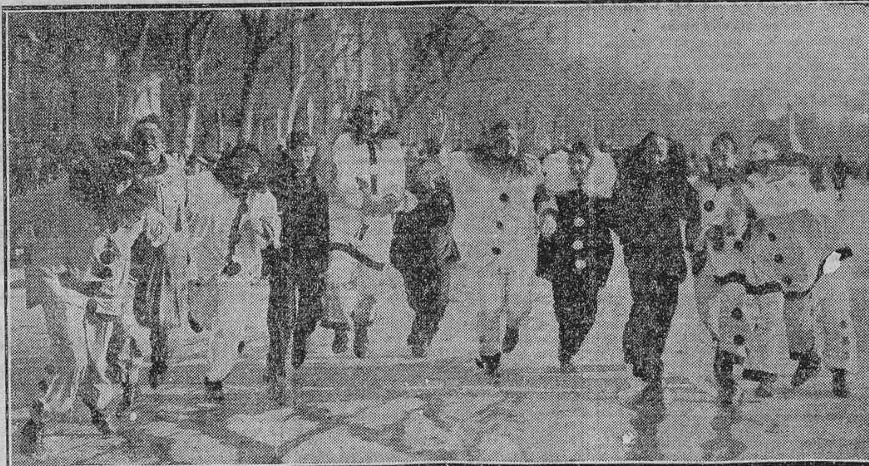
LOS HEROES DEL DIA