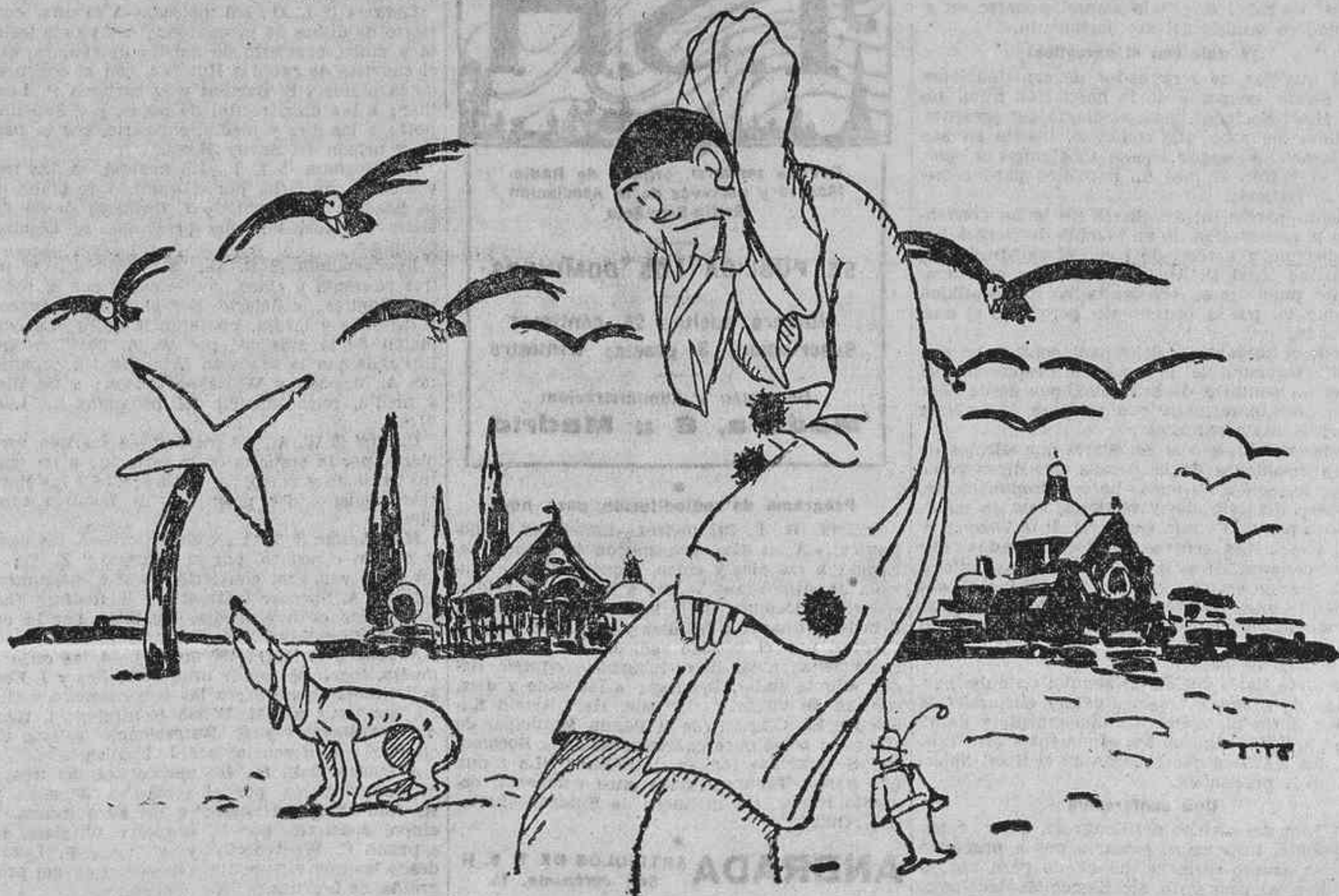
«¡Venga alegría, señores!...» (Música popular)