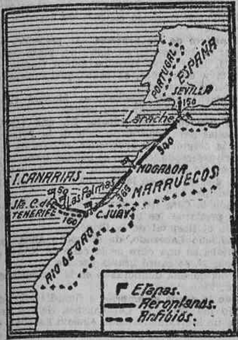
EL FALSO GRAFICO DE UN COLEGA