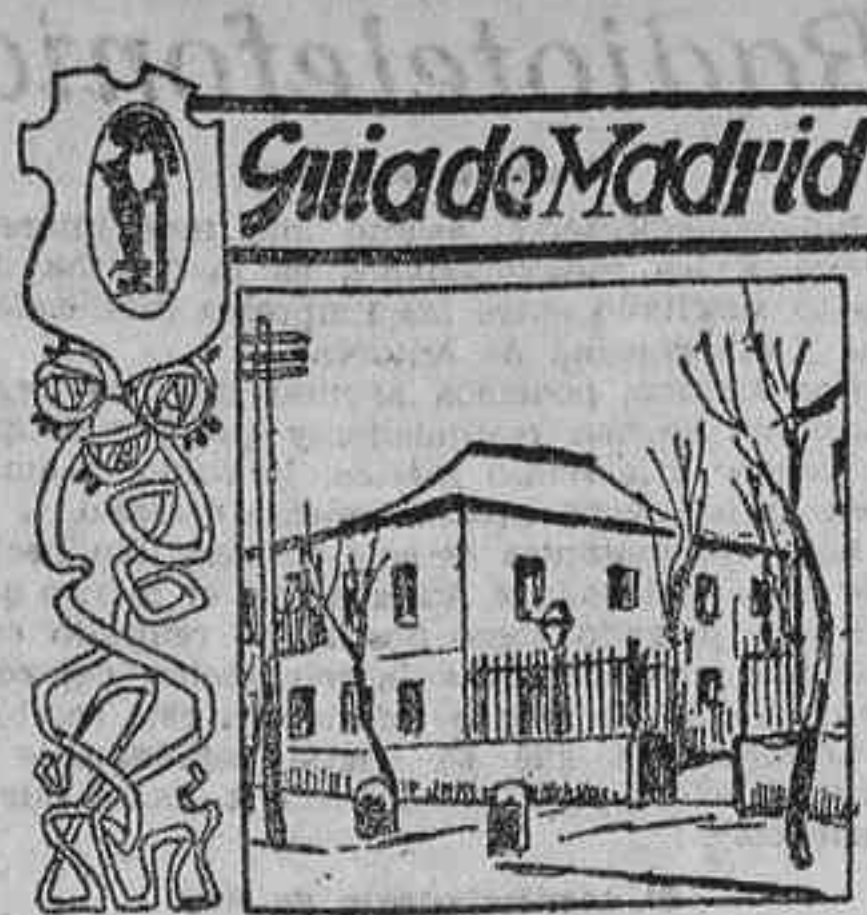
Calle de Santa Engracia

Riga, 14.—El día 6 del corriente mes de Febrero salieron de Petrogrado, con dirección a la región del Aist, 346 condenados políticos, obreros e intelectuales, que habían tomado parte en huelgas o habían llevado a cabo propagandas que fueron consideradas como ilegales.