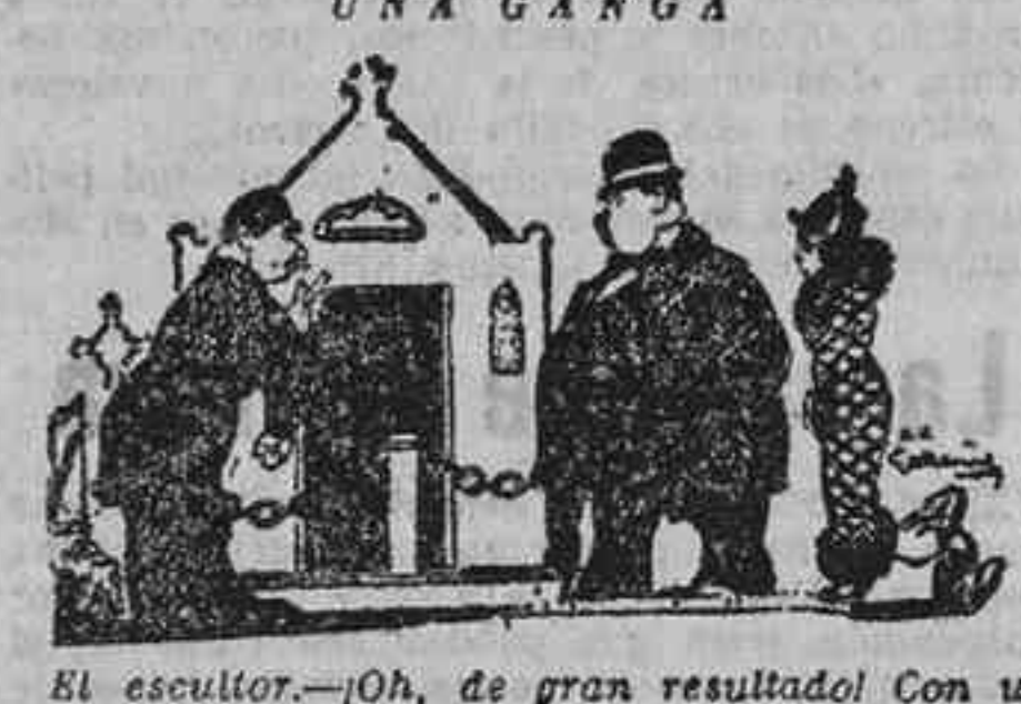
«El escultor.—Oh, de gran resultado! Con un sarcófago como éste, tiene usted para toda su vida.»