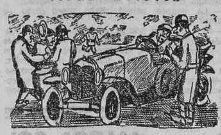
«Un testigo, al «chauffeur».—Gracias a vuestra sangre fría no ha habido una desgracia.»