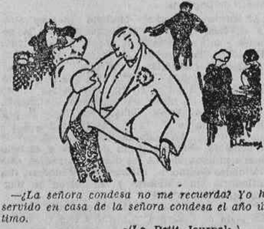
«La señora condessa no me recuerda? Yo he servido en casa de la señora condessa el año último.»