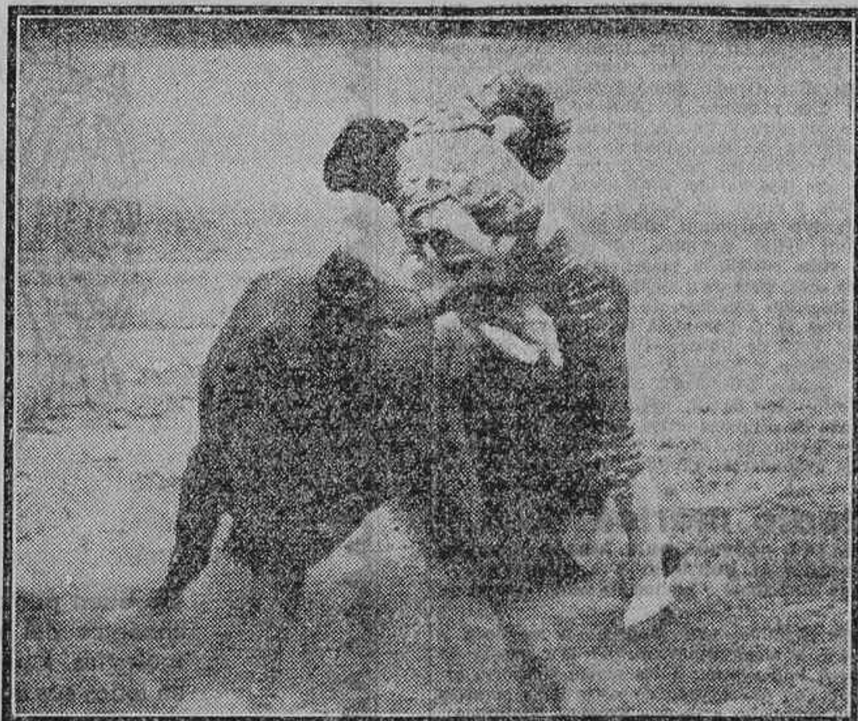
NACIONAL II EN EL «PUENTE TRAGICO»

A mal tiempo, buena cara Con tiempo ventoso y amenazando lluvia, el