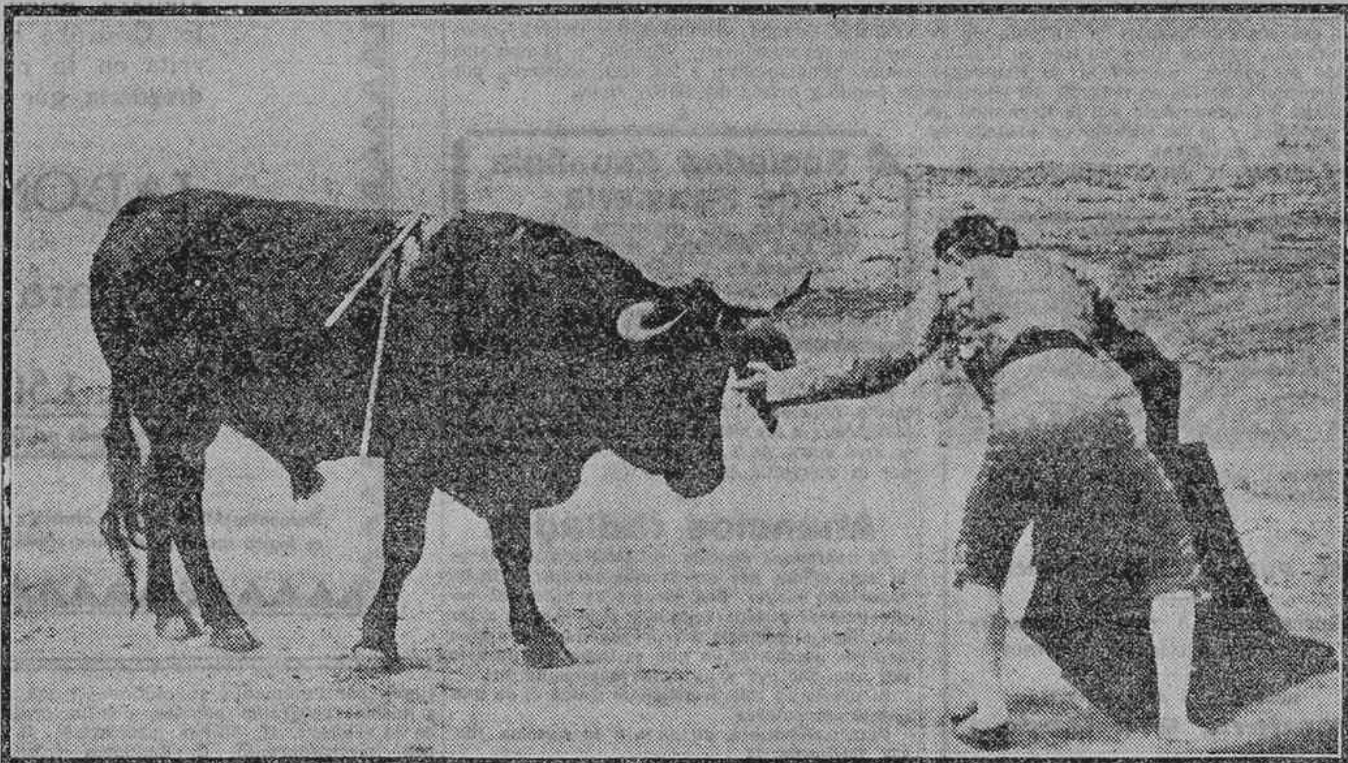
MARCIAL LALANDA ADORNANDOSE EN EL TORO DEL QUE CORTO LA OREJA

palmas, y sonó para el torero la primera ovación de la tarde. Y luego vino la faena grande, la faena de arte, la faena de torero que tenía que hacer Marcial Lalanda, la faena que empezó con tres naturales primorosos, que ligó con uno de pecho y que, luego de dejar refrescarse al toro, siguió con cinco naturales más, corriendo la mano y templando admirablemente, y después, con la muleta en la derecha, cerca y esdrújandose, comple-