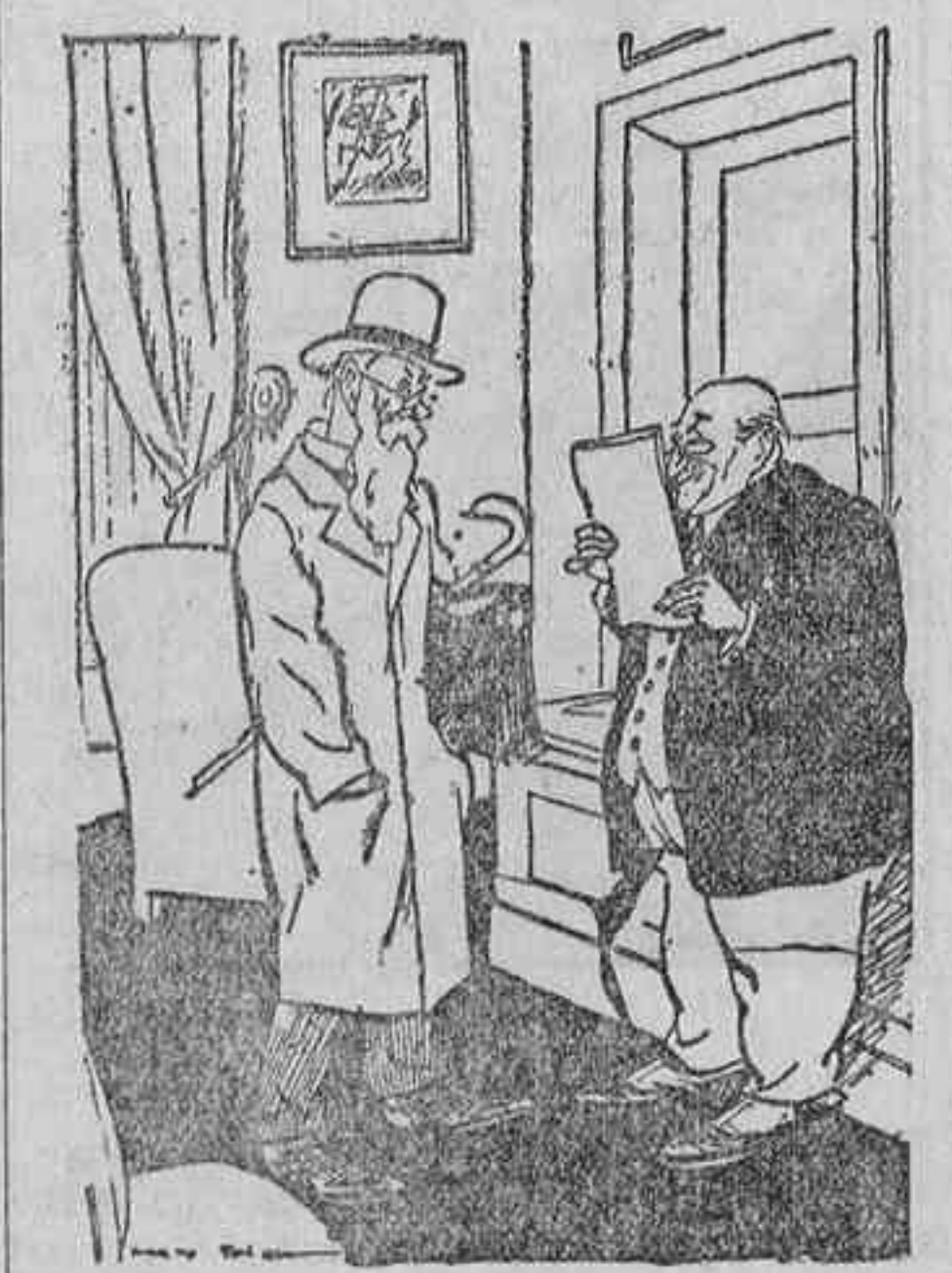
—Este año no habrá impuestos nuevos... —Gracias a Dios! —Pero se elevarán los antiguos. (Le Journal Amusant.)