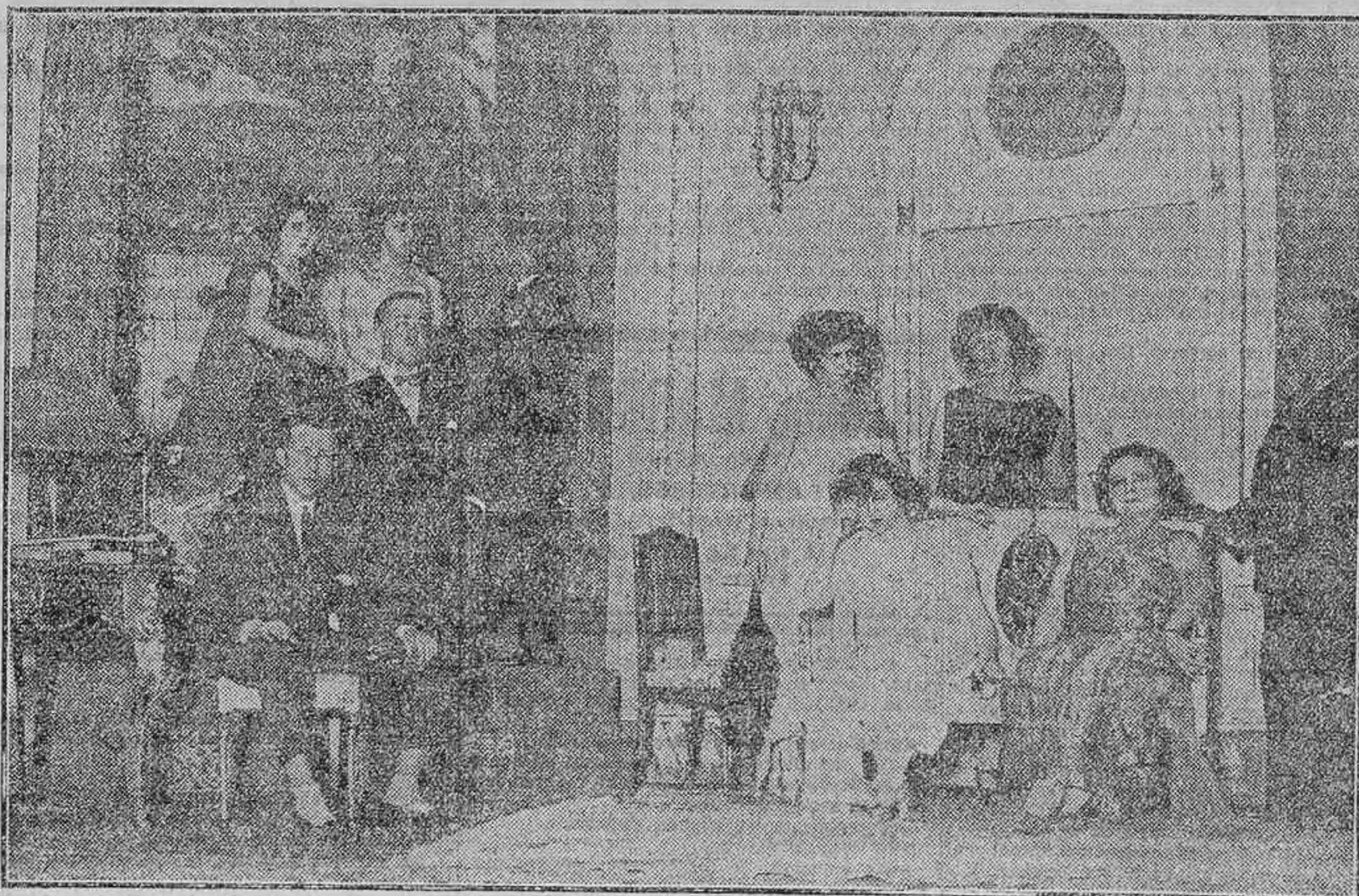
UNA ESCENA DE LA COMEDIA 'EL ENGAÑO', DE LEZAMA Y MENESES, ESTRENADA AYER EN EL REINA VICTORIA