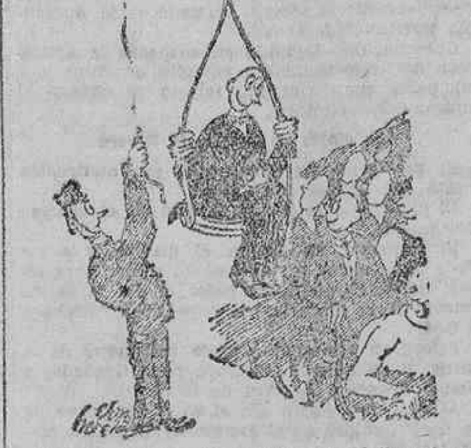
Aparato que permite transportar fácilmente a los retrasados a sus asientos sin molestar a los vecinos.