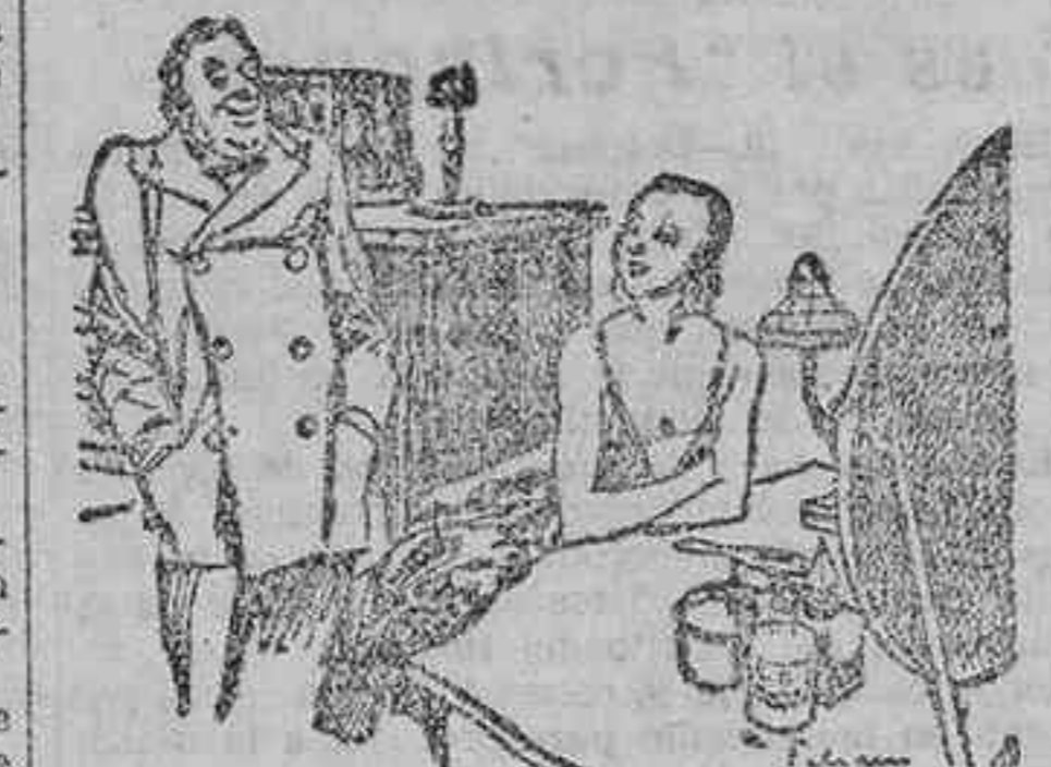
«Cuando yo tenía juventud, no tenía un céntimo, y ahora que soy rico, se ha marchado la juventud.»