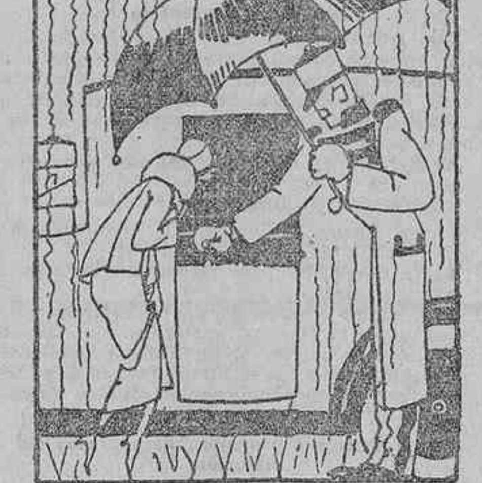
El otoño marca a los hombres la época de reintegrarse a la lucha.