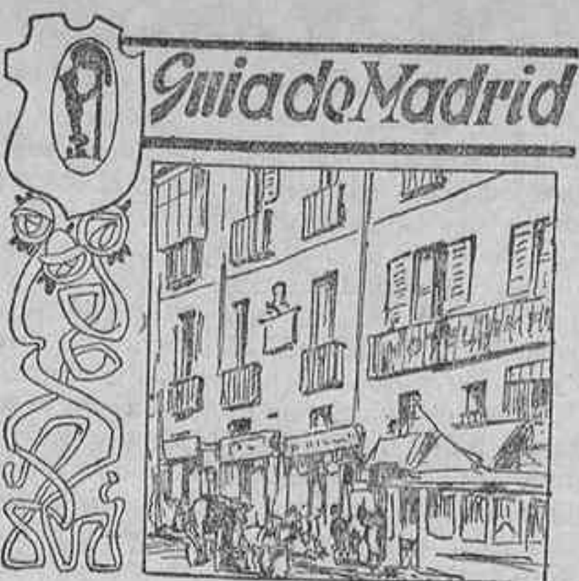
Calle de la Montera

Próxima la inauguración de nuestro nuevo edificio de la calle de la Madera, núm. 8, advertimos a nuestros suscriptores, anunciantes y público en general que para cualquier asunto administrativo deberán dirigirse ya a la nueva Casa de LA LIBERTAD, siendo la entrada para las oficinas por SAN ROQUE, 7