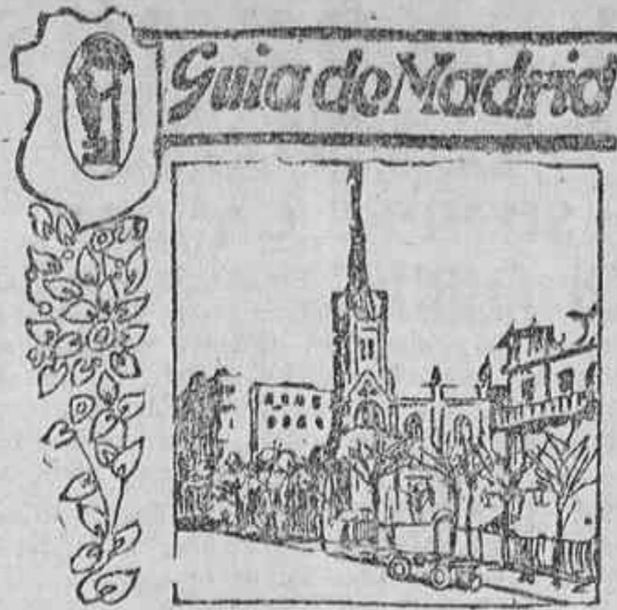
Calle de Goya