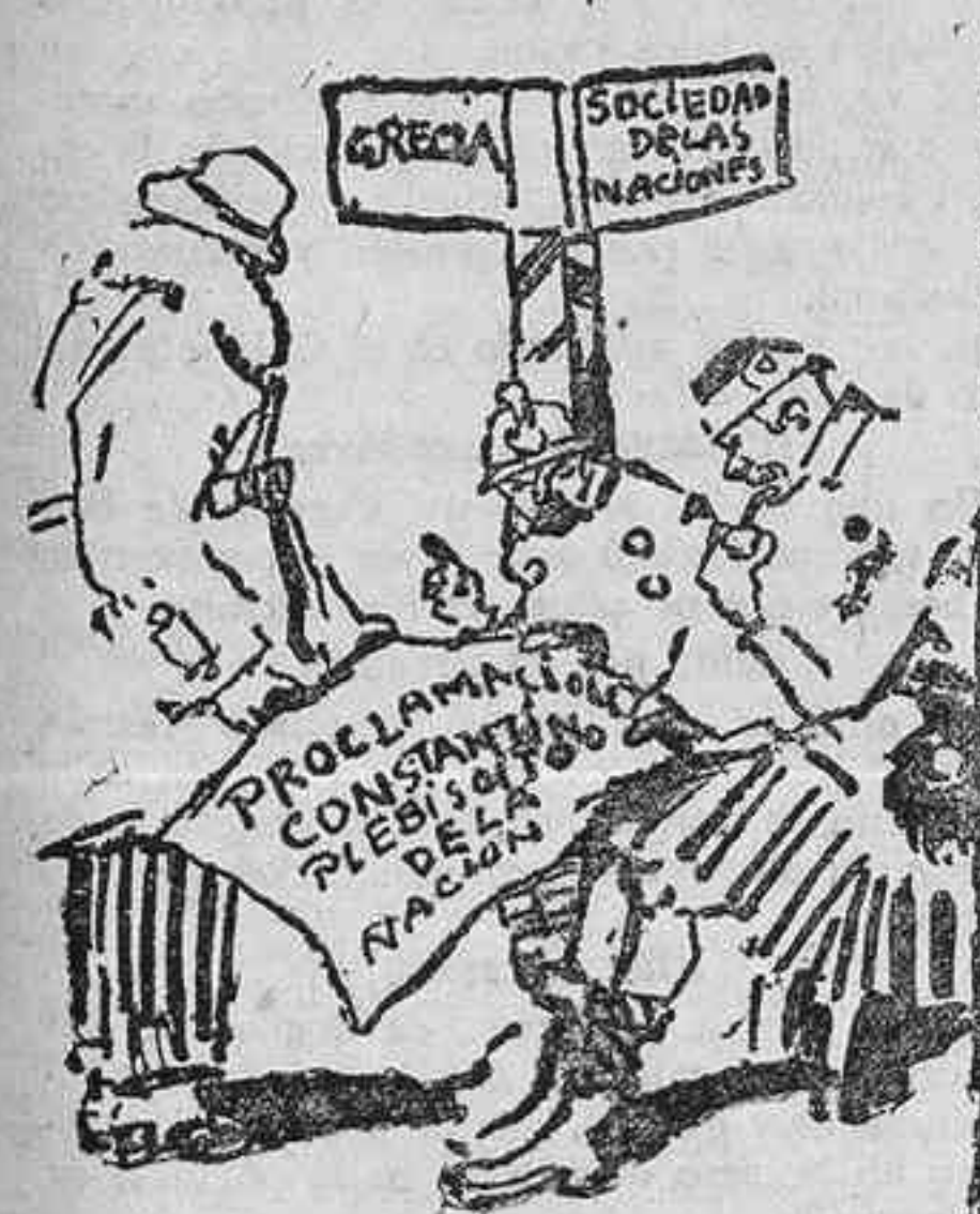
Francia e Inglaterra.—Esto no puede pasar. Constantino.—¿Y si pago lo que debo, también?