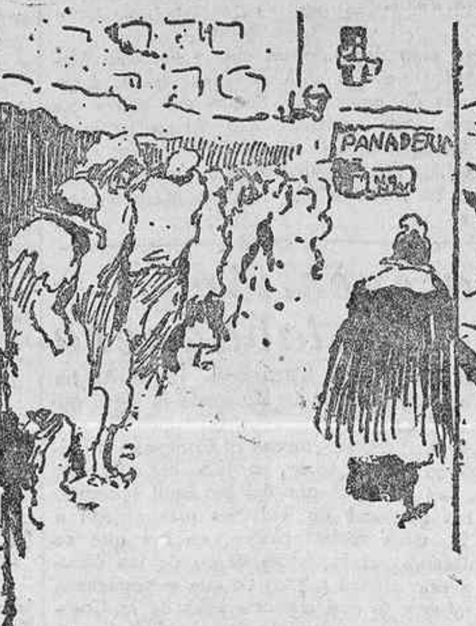
No hay pan, ni aceite, ni tabaco y... ¡todos encantados!