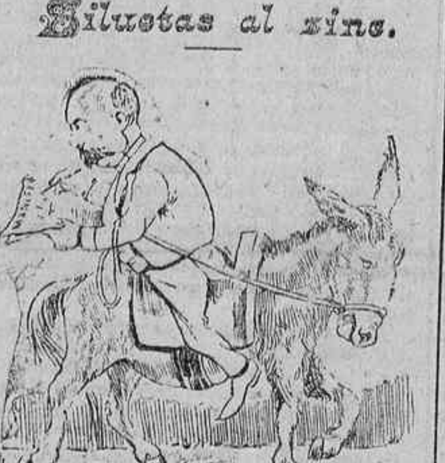
D. Emilio prepara su viaje de propaganda, con objeto de escribir un manifiesto á los electores de Huesca.