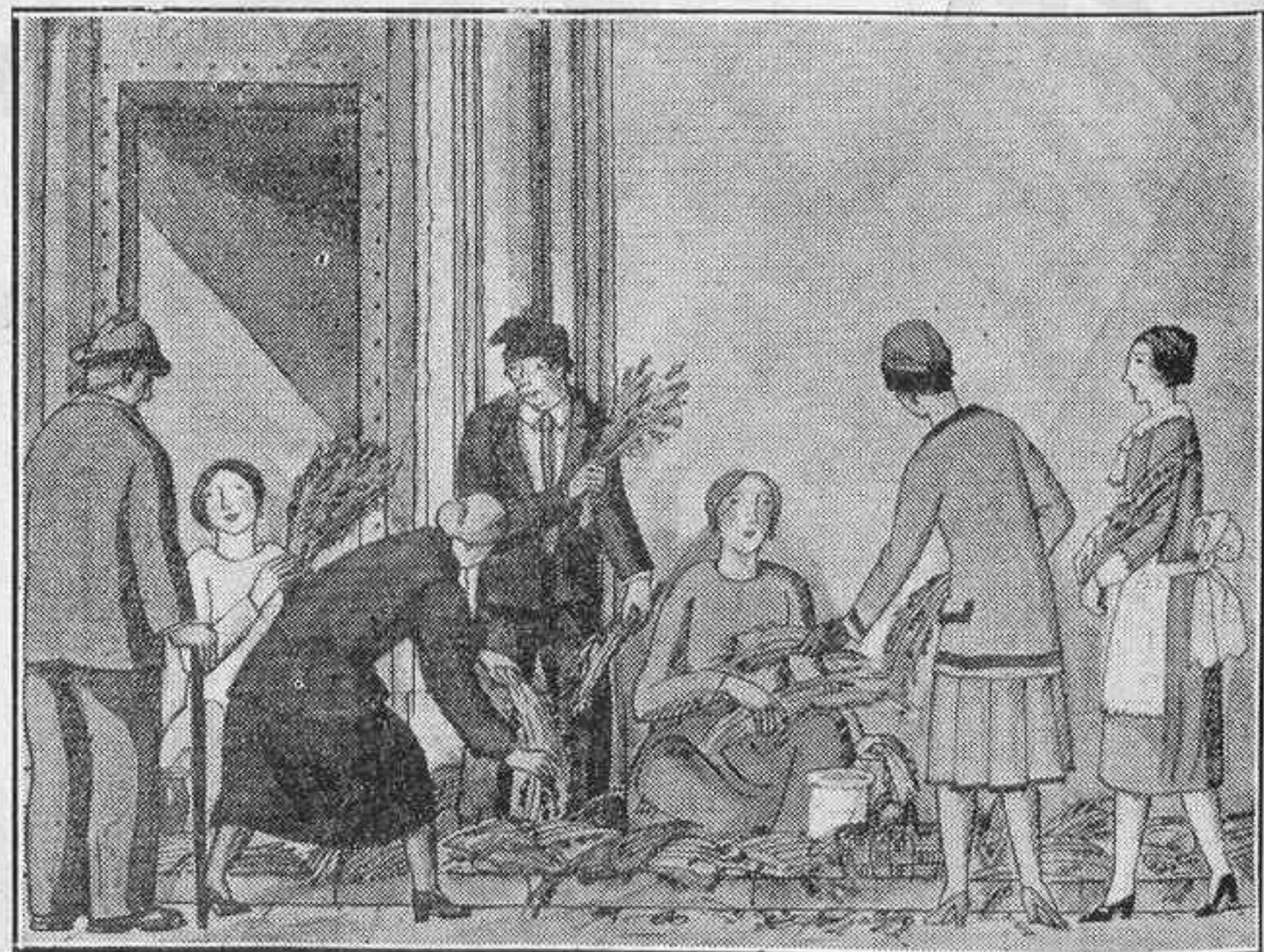
LA BARCELONA TÍPICA

Ja era hora que algú es preocupés dels establiments de Barcelona i, d'una manera ó altra, s'intentés recompensar-los de les moltes pessetes que li ha costat l'Exposició. Per això diem sincerament que és un encert aquest concurs, i estem segurs que els nostres botiguers rivalitzaran en adornar i il·luminar llurs establiments per a emportar-se algun dels llaminers premis.