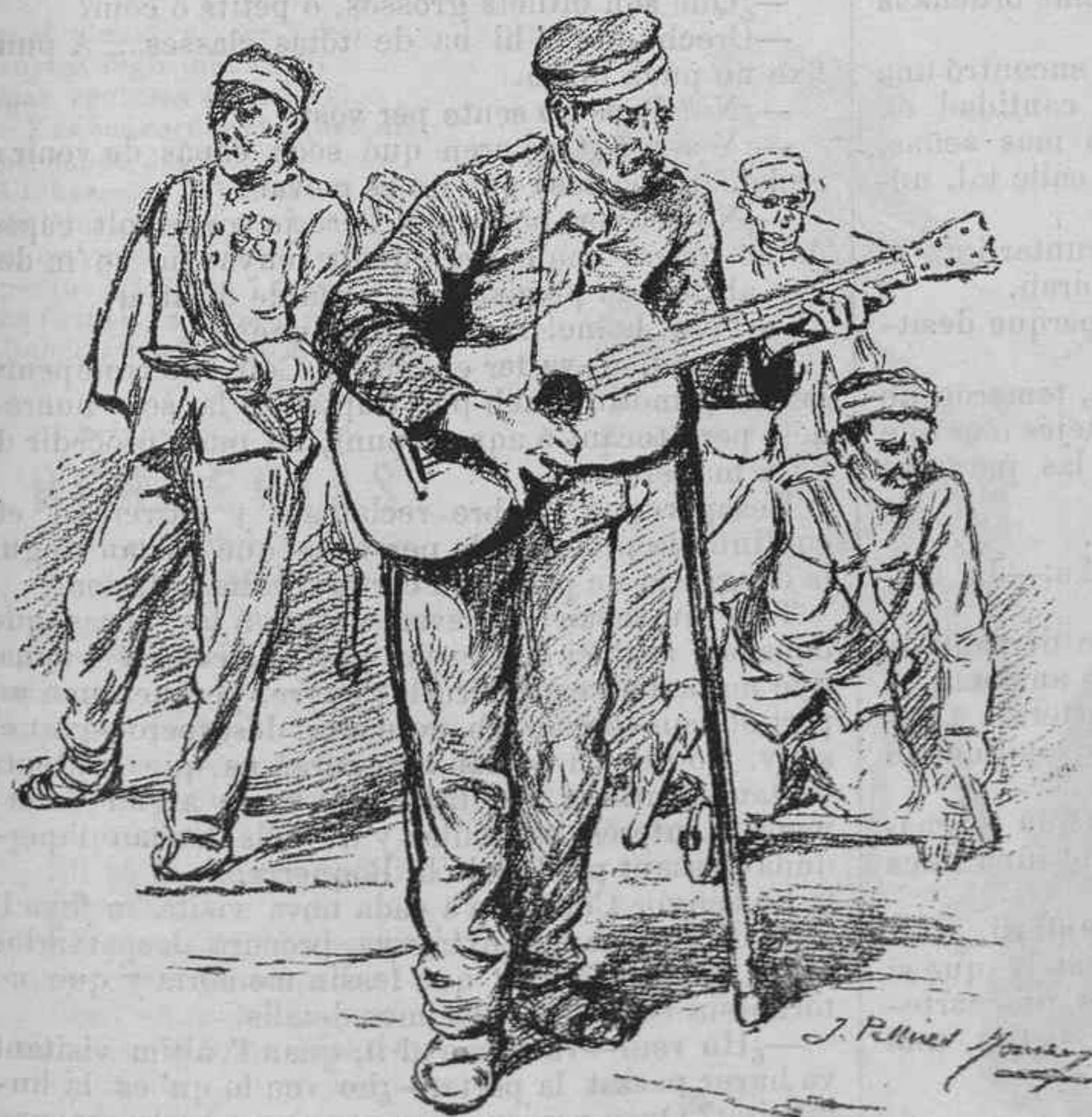
Baldats y ferits, sufrint y plorant.