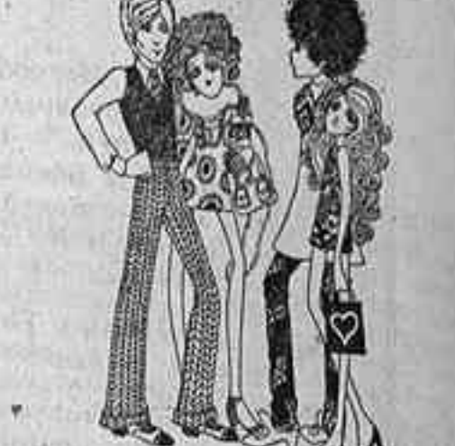
Carnaby Street, después de haber despertado el interés de los jóvenes de todas las partes del mundo, se desvela poniendo los medios para mantener esa atención. Dentro de la aparente uniformidad, propone tal variedad de orientaciones, de diseños, de tejidos, de colores, que si, a permanente carnaval, ello permite que hasta los espíritus más adocados encuentren algo a la medida de su capricho. El dibujo da idea de sus posibilidades.