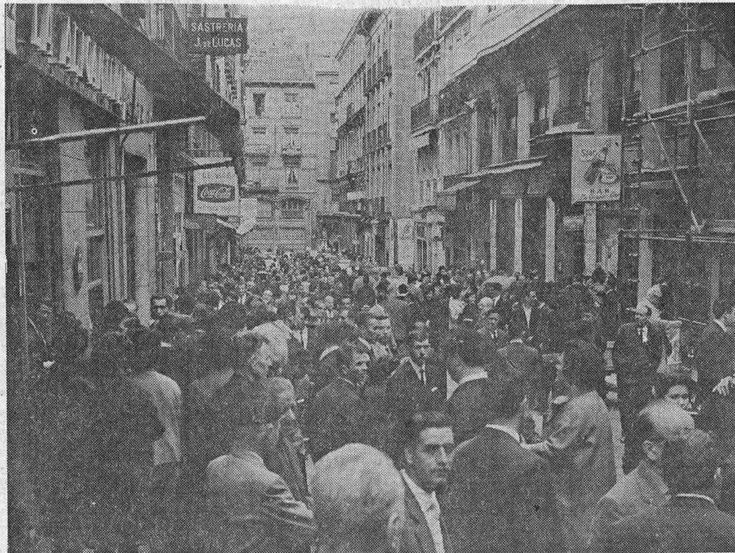
En nueve años, la población madrileña ha aumentado en un millón de habitantes. Supone un ritmo de crecimiento extraordinario. En el desarrollo demográfico europeo, Madrid ocupa uno de los índices más elevados. En cualquier lugar y a cualquier hora, la concurrencia es siempre numerosísima.

Posiblemente, el próximo jueves llegue el madrileño tres millones. El acontecimiento será celebrado con júbilo, porque señala un hito importante en el saludable crecimiento de la población. Apenas, sin embargo, al mismo tiempo, este pujante desarrollo, porque Madrid se desmembra y pierde su carácter entrañable, como le sucede a la madre que ve medrar a su retoño y teme que de un momento a otro habrá de alejarse de ella. Pero éste es un fenómeno biológico irremediable, que hay que estimar en su realidad. El sábado, a última hora, fue concluido el censo correspondiente al mes de julio, y la población madrileña se estimaba en 2.997.893 habitantes. Es decir, que para redondear la cifra de tres millones no faltaban más que 2.107 altas en el censo. Como el crecimiento se calcula en unos 250 madrileños diarios, el acontecimiento se producirá el jueves, en las postreras horas de la noche.