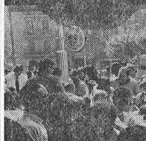
Al millón de habitantes se llegó a principios de enero de 1955, aunque ya desde mucho antes se hablaba de que se había rebasado esa cifra. Hoy, y en vísperas de alcanzar los tres millones, la ciudad crepita de animación.

En el distrito del Centro, en cambio, de manera habitual, no nace un solo niño, porque no hay ninguna maternidad, y, como es sabido, desde hace ya muchos años los alumbramientos no se producen en los domicilios. Hace cien años.