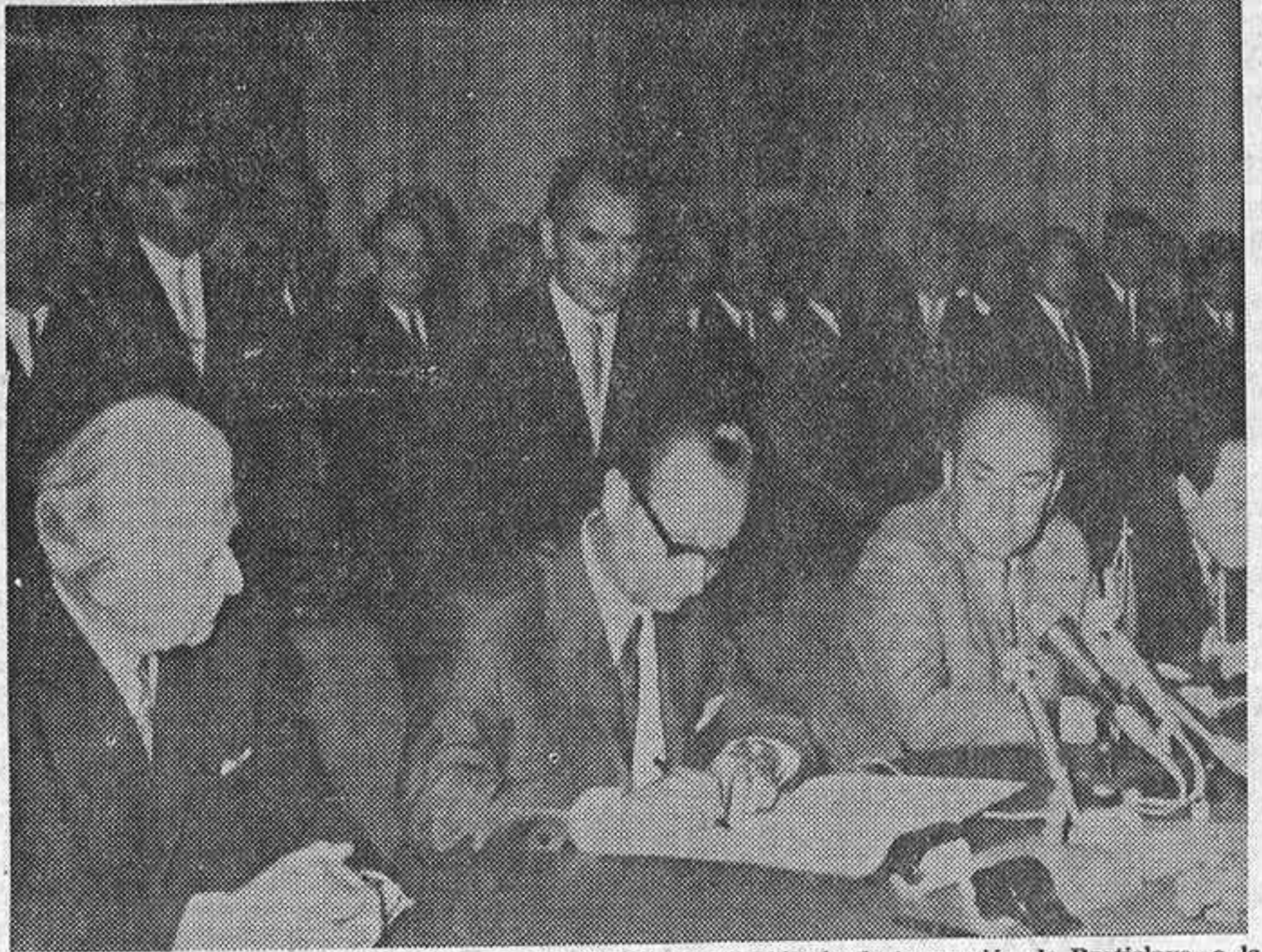
El dirigente checoslovaco Alexander Dubcek firmó el comunicado de la reunión de Bratislava, a la que asistieron, además de Checoslovaquia, la U. R. S. S., Bulgaria, Hungría, Alemania oriental y Polonia.