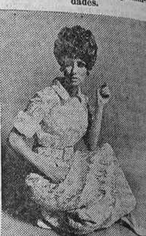
Hardy Amies ha presentado en su reciente pase para el otoño-invierno 68-69 vestidos más entallados, faldas más largas para la tarde, chaquetas igualmente largas, muchos cinturones, tejidos muy ricos en los trajes de fiesta o gala. Ha desestimado los tonos estridentes y ha usado ampliamente lanas suaves, punto estampado, lanas y brocados. El modelo de la foto es largo, para cena, en crema y oro; un cinturón ancho lo ajusta formando dos pliegues en la falda que ocultan sendos bolsillos. Las bocanangas están rematadas con piel de armiña.

En el extremo opuesto a lo que representa Hardy Amies tropezamos con John Stephen, el hombre que consiguió hacer de Carnaby Street un centro de moda mundial. Stephen se estableció allí hace unos siete años, y la convirtió en una especie de "club" juvenil, donde se reúnen los chicos y las chicas de Londres. Aparte de los comercios, que ahora mismo ya son siete, todos diferentes y todos, sin embargo, de moda, Stephen abrió cafeterías y bares para a que sus clientes se encontraran completamente a gusto. Otros comerciantes, comprobado su éxito, siguieron su ejemplo. En poco terreno, dos manzanas y media por un lado y mucho menos por el otro acera, Carnaby es lugar de cita de ciudadanos de todo el mundo, muchos de los cuales, naturalmente, se cargan de camisas, corbatas, pantalones, vestidos, pañuelos, colgantes, pendientes, gafas, etc., con el sello de la calle que les interesa ya más que la etiqueta: "Made in England".