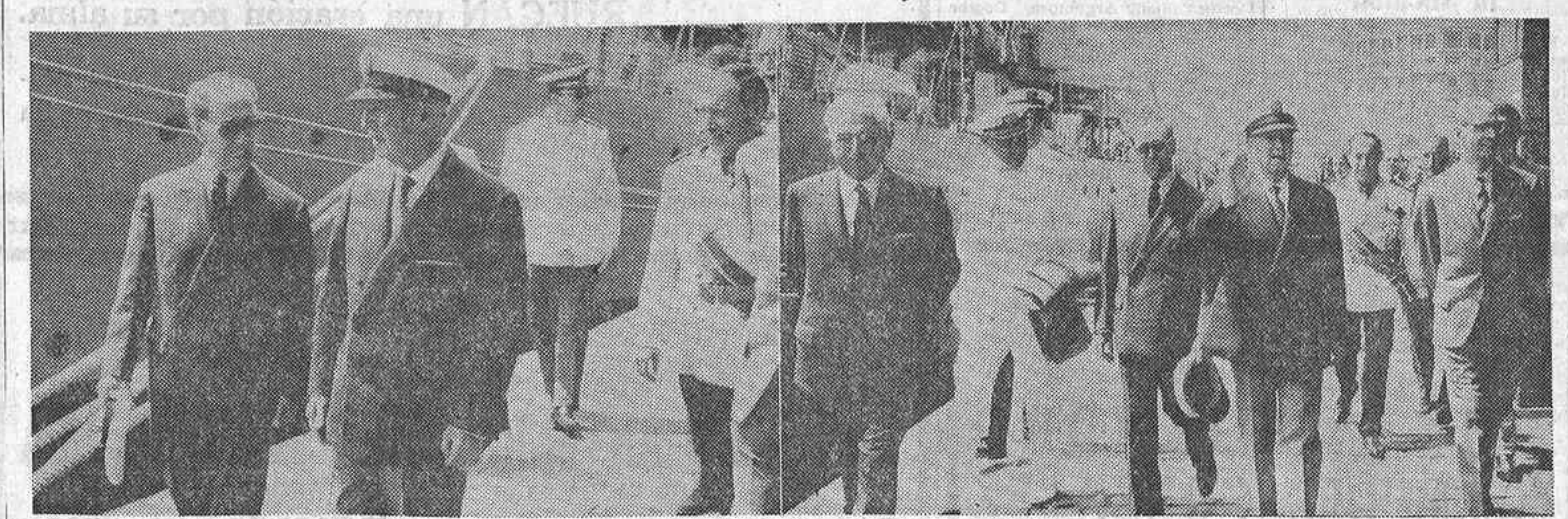
El Jefe del Estado, acompañado del ministro de Marina, a su llegada al Club Náutico, desde donde se dirigió al yate "Azor". El Generalísimo Franco correspondió a las aclamaciones del gran gentío estacionado en las inmediaciones del Club Náutico de La Coruña.

DISCURSO DE GARCIA MONCO EN GIJON SENSIBLE AVANCE DE LAS EXPORTACIONES EN EL PRIMER SEMESTRE