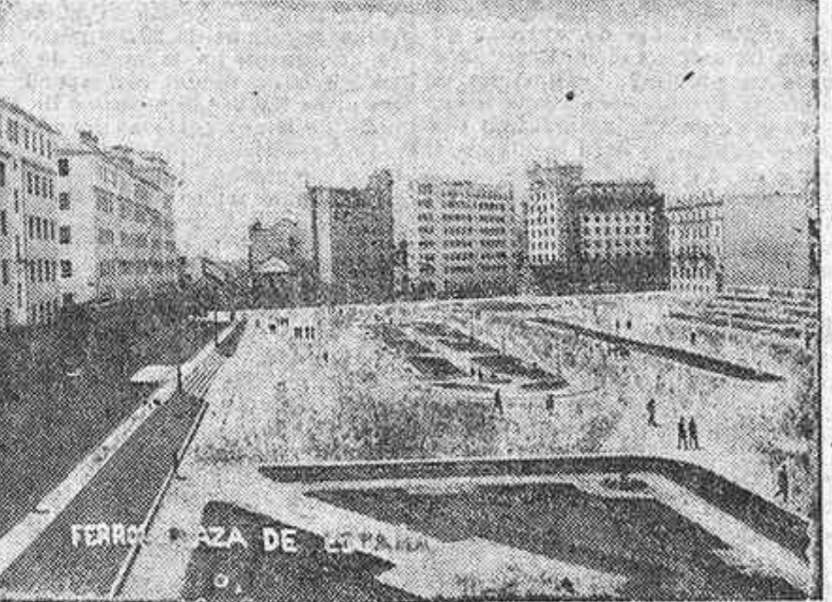
Esta plaza espléndida, una de las más bellas de España, era hace cinco lustros una puerta en las murallas de El Ferrol del Caudillo