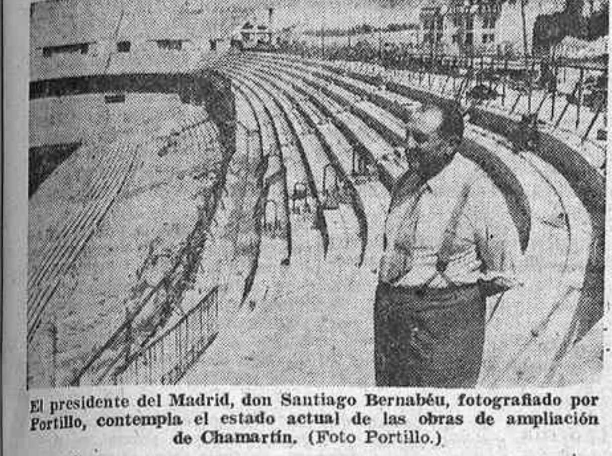
El presidente del Madrid, don Santiago Bernabéu, fotografiado por Portillo, contempla el estado actual de las obras de ampliación de Chamartín. (Foto Portillo).

El Real Madrid podrá establecer, gracias a su campo monumental, precios ultrabaratitos en las localidades populares