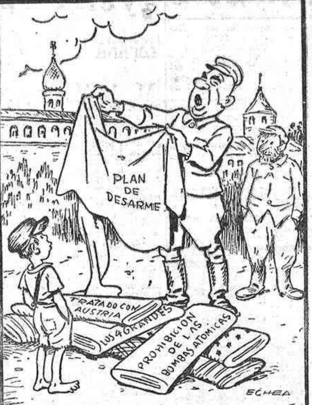
GROMYKO.—¡Ya llegaron los saldos! ¡Géneros superiores de fantasía, de completa fantasía! ¡Véanlos, examínelos, aquí no se engaña a nadie!