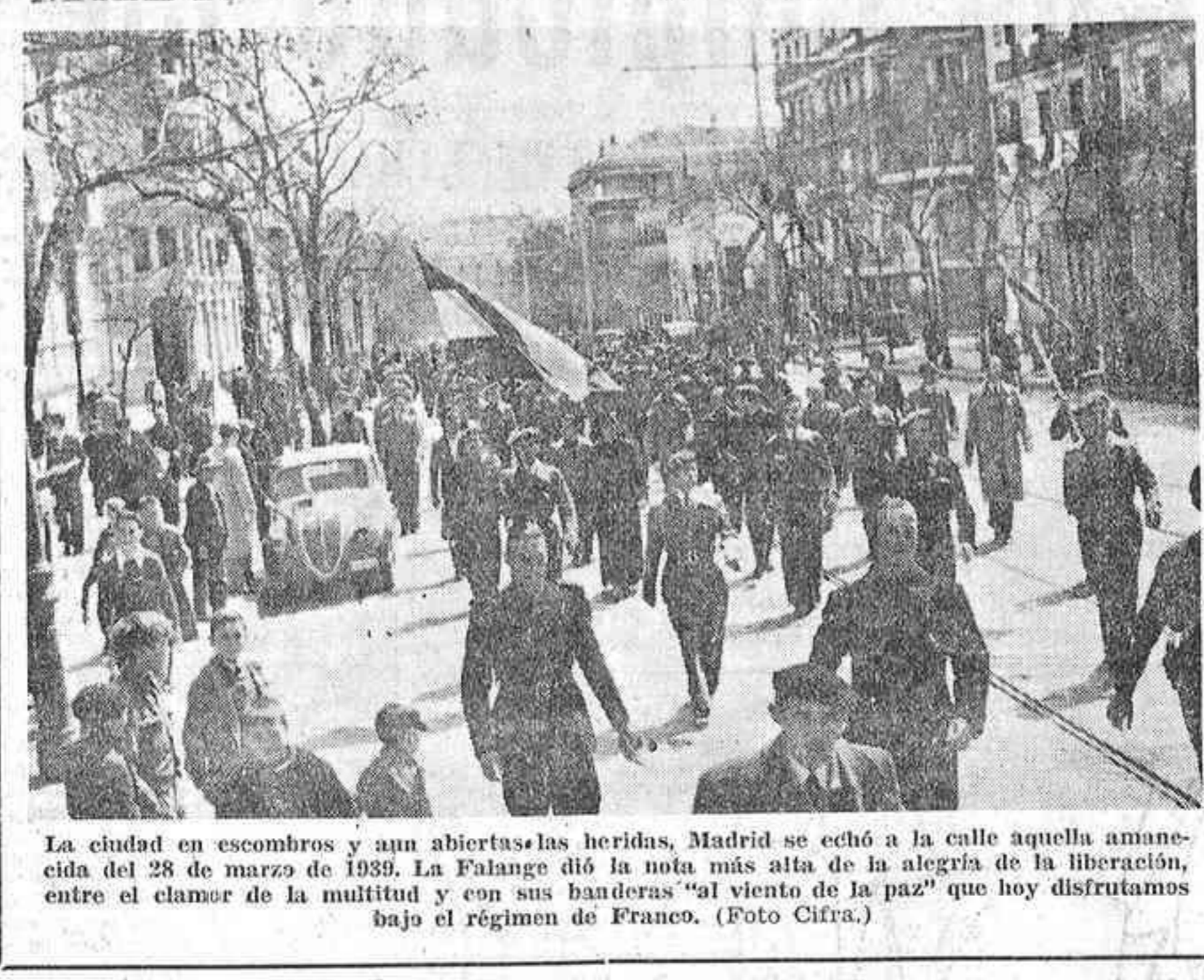
La ciudad en escombros y aun abiertas las heridas, Madrid se echó a la calle aquella amanecida del 28 de marzo de 1939. La Falange dió la nota más alta de la alegría de la liberación, entre el clamor de la multitud y con sus banderas "al viento de la paz" que hoy disfrutamos bajo el régimen de Franco.