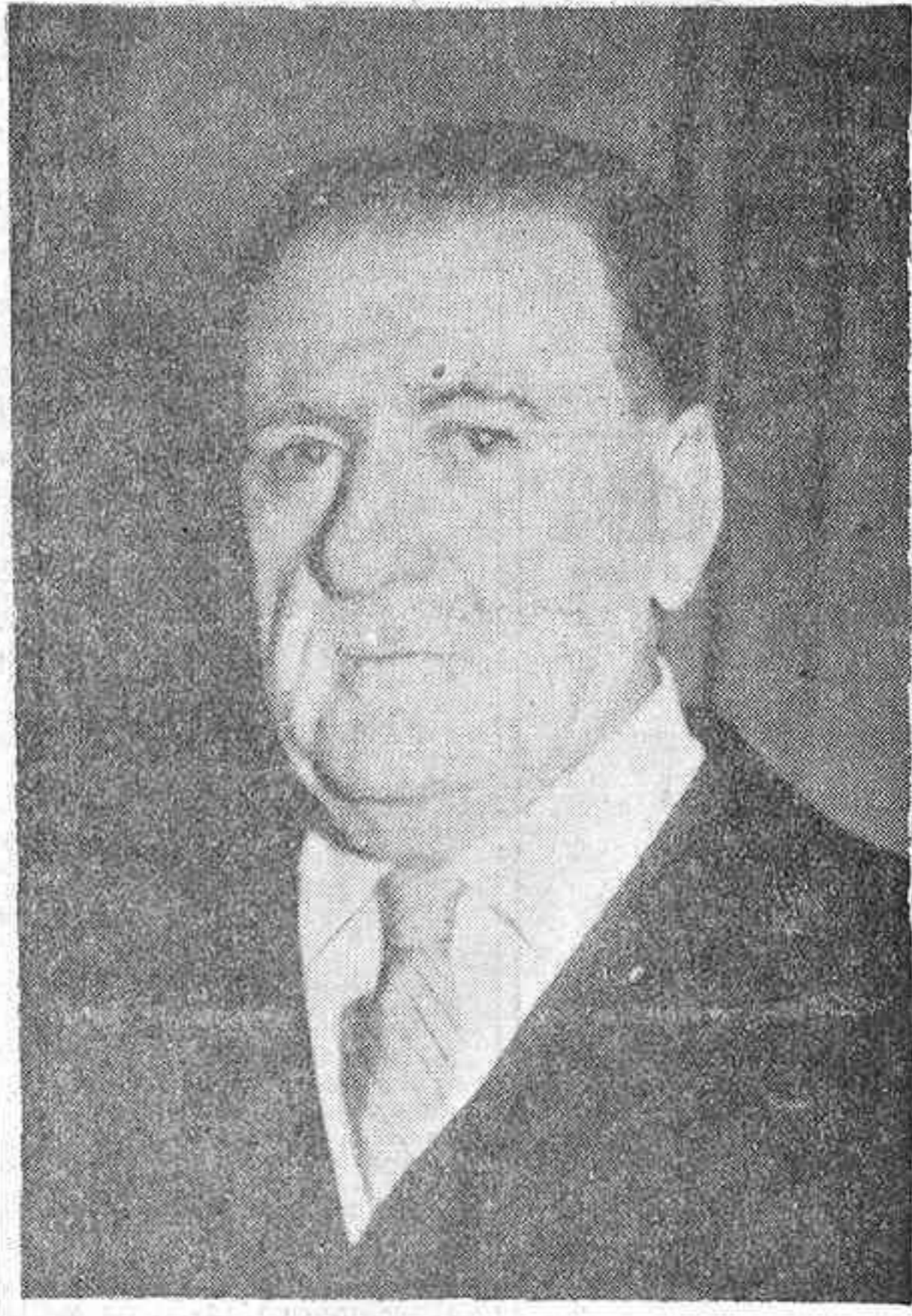
El ilustre periodista don Manuel Aznar, nuevo presidente de la Asociación de la Prensa.

Por una muy copiosa votación, don Manuel Aznar es designado presidente de la Asociación de la Prensa de Madrid. Con el presidente, la Asociación de la Prensa de Madrid ha renovado además la mitad de su Junta directiva,