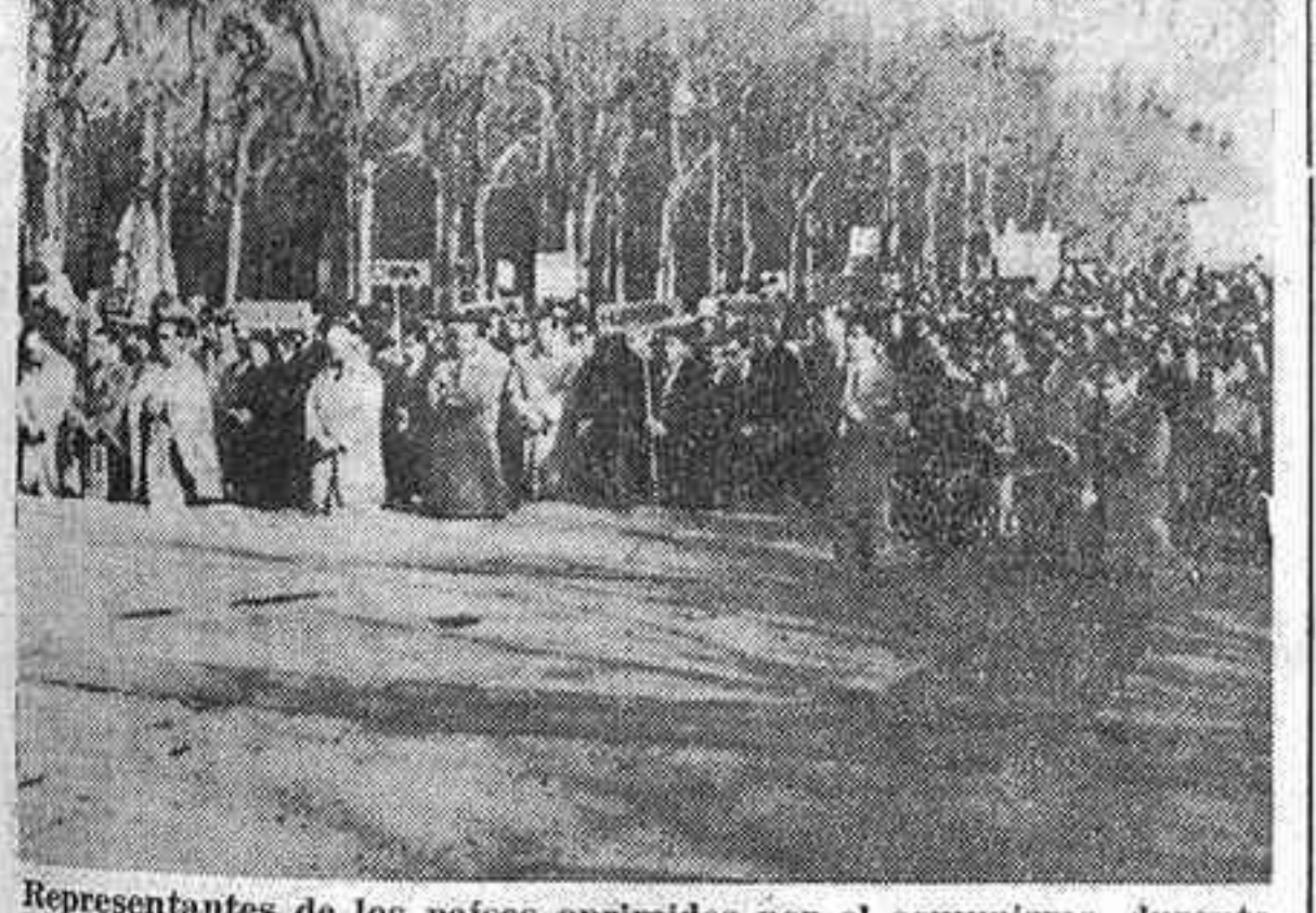
Representantes de los países oprimidos por el comunismo, durante la bendición impartida por el obispo auxiliar de Madrid-Alcalá, doctor Lahiguera.

El pueblo de Madrid respondió con gran entusiasmo y devoción al llamamiento de los reverendísimos metropolitanos españoles, para celebrar ayer domingo, Día de la Iglesia Perseguida, el económico rosario de penitencia. Pueden calcularse en 120.000 personas de todas clases sociales que se agruparon en torno a sus respectivas parroquias para formar parte de la gran comitiva, que, sin interrupción, iba recorriendo el santo rosario. A las siete de la mañana la plaza de España y las calles inmediatas se encontraban totalmente ocupadas por gran número de fieles, alrededor de pancartas indicadoras del nombre de las parroquias madrileñas. Un especial servicio de autobuses y Metro permitió el desplazamiento de