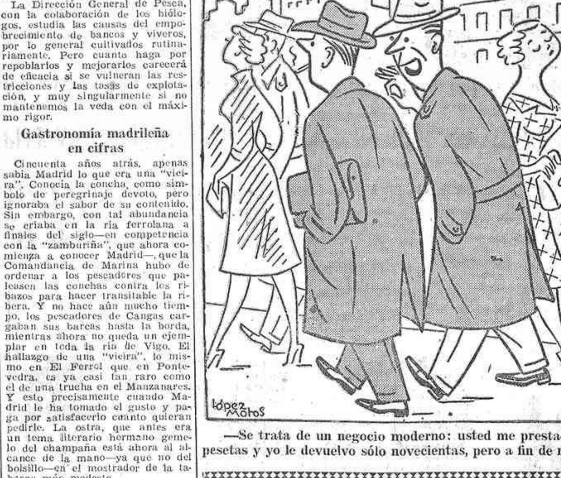
—Se trata de un negocio moderno: usted me presta mil pesetas y yo le devuelvo sólo novecientas, pero a fin de mes.