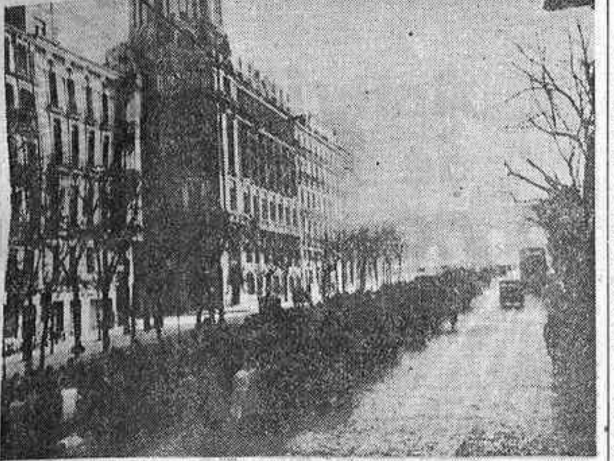
Participantes en el rosario de penitencia por la Iglesia perseguida, en su ascensión por la calle de Alcalá, camino del paseo de coches del Retiro, donde oyeron la santa misa.

Con los católicos madrileños formaron varios centenares de exiliados de los países oprimidos