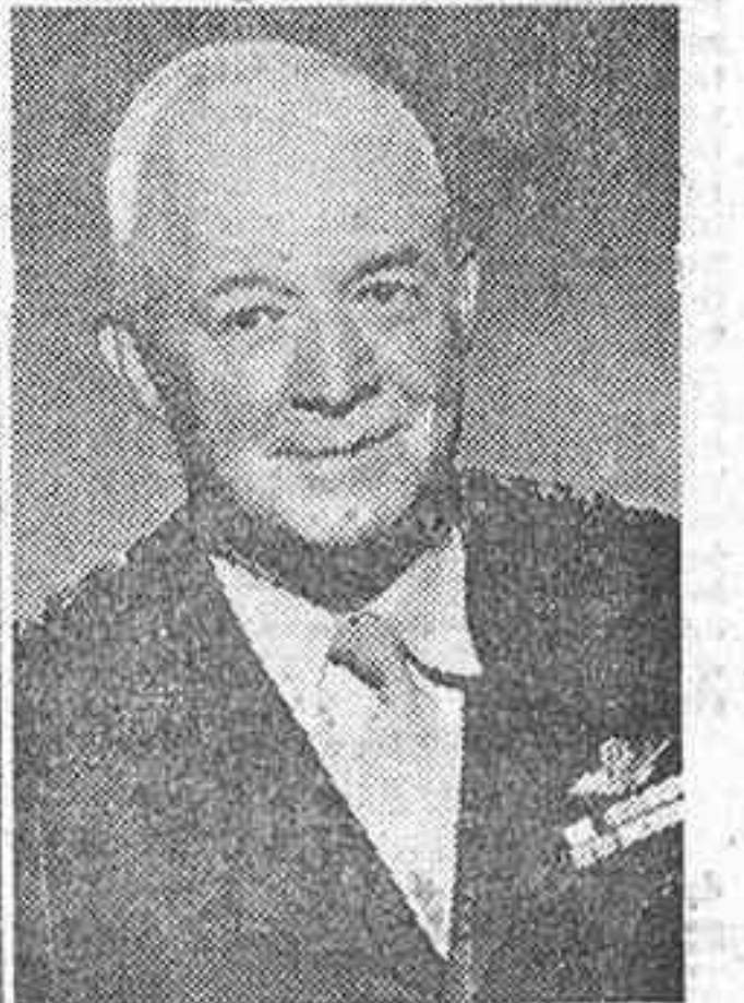
El general Arnold, jefe de la Aviación de los Estados Unidos en la pasada guerra.

FUE EL JEFE DE LA AVIACION NORTEAMERICANA DURANTE LA GUERRA