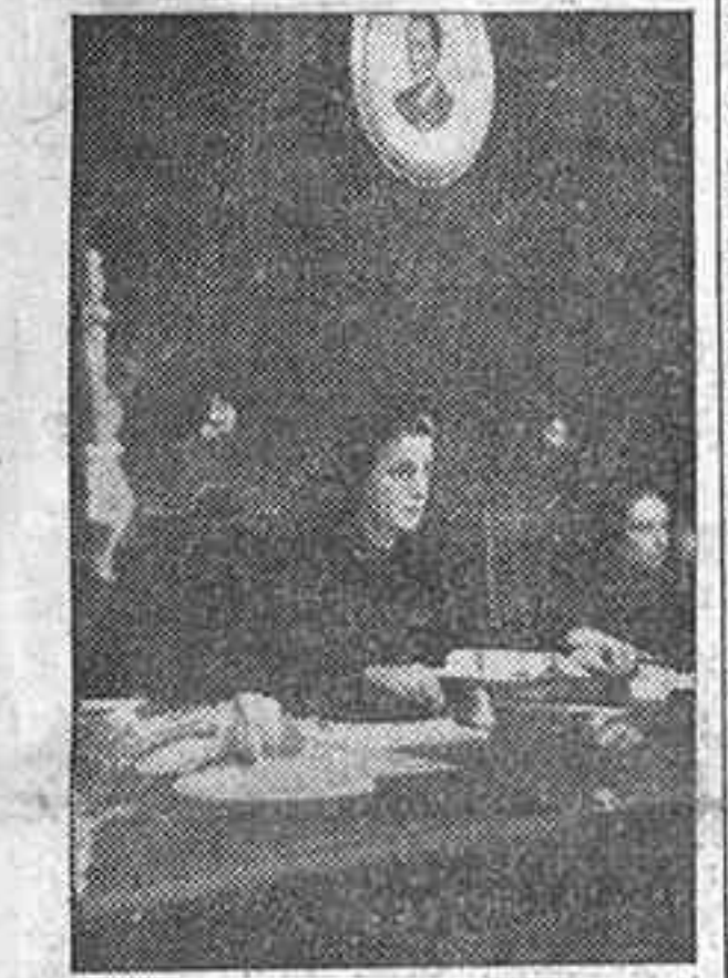
La delegada nacional de la Sección Femenina, Pilar Primo de Rivera, que en la mañana de ayer inauguró en Tarragona el XIV Consejo Nacional de la citada Sección.

TARRAGONA, 15.—Esta mañana, coincidiendo con el aniversario de la liberación de Tarragona, se ha celebrado el acto inaugural del XIV Consejo Nacional de la Sección Femenina, en el que han participado, bajo la presidencia de la delegada nacional, Pilar Primo de Rivera, y de las jerarquías nacionales de la Sección Femenina, cerca de doscientas representantes de la Federación de todas las provincias.