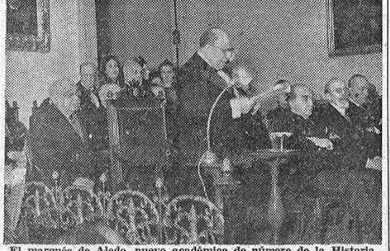
El marqués de Aledo, nuevo académico de número de la Historia, durante la lectura, en la tarde de ayer, de su discurso de ingreso en aquella docta Corporación.

Su discurso de ingreso versó sobre "Viajes oficiales, por España, de Isabel II"