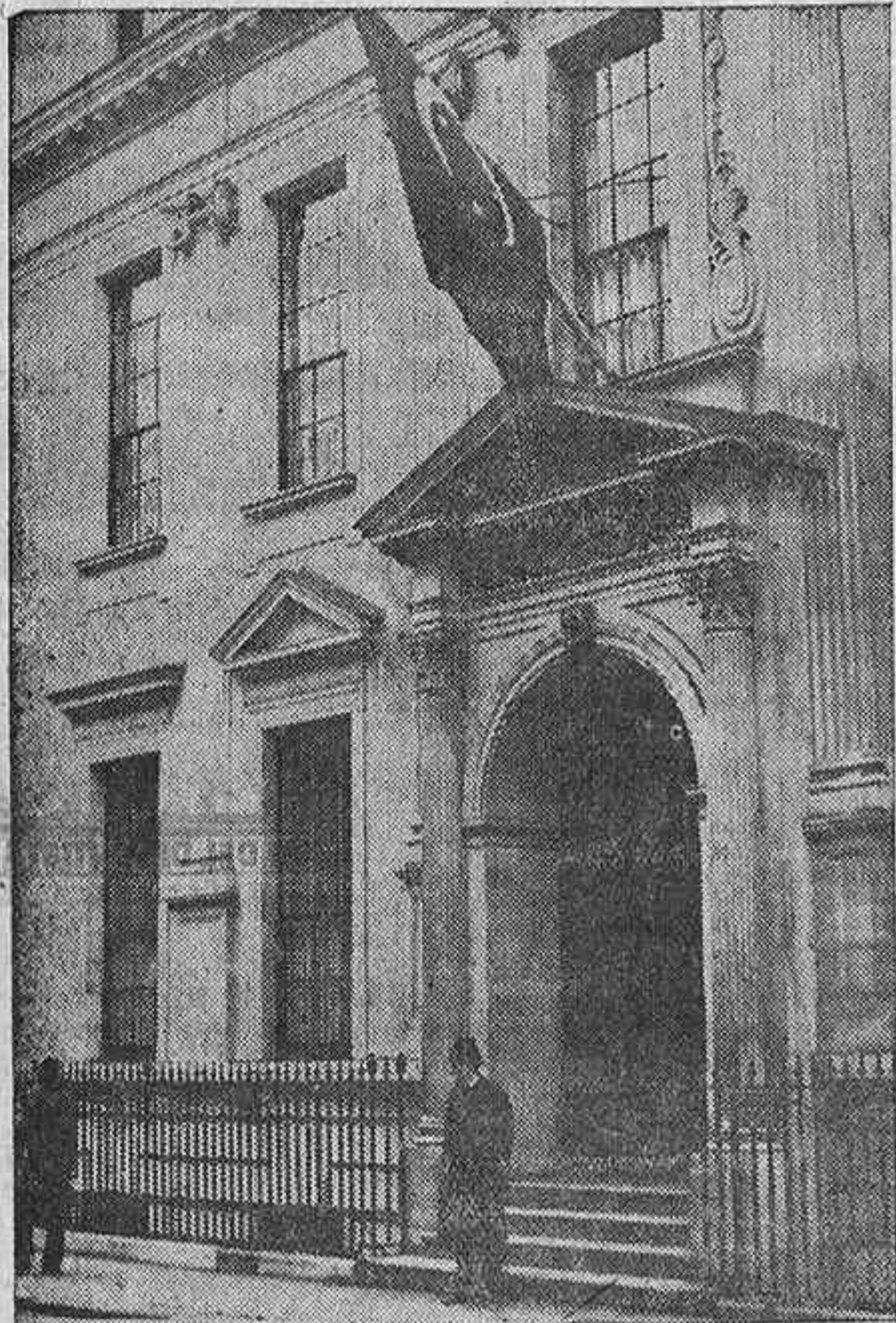
Entrada de la Embajada egipcia en Londres, que ahora queda atendida por un simple encargado de Negocios, después de la retirada oficial del embajador.