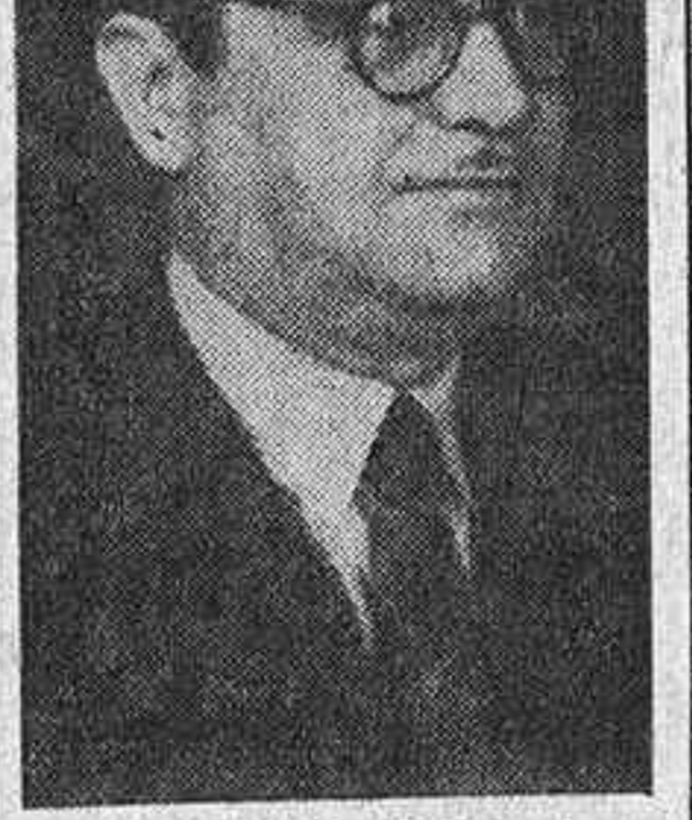
Don Antonio de Miguel

El ilustre economista y escritor don Antonio de Miguel ha sido nombrado para representar oficialmente a España en la Conferencia Internacional de Estadística que se celebrará en Nueva Delhi