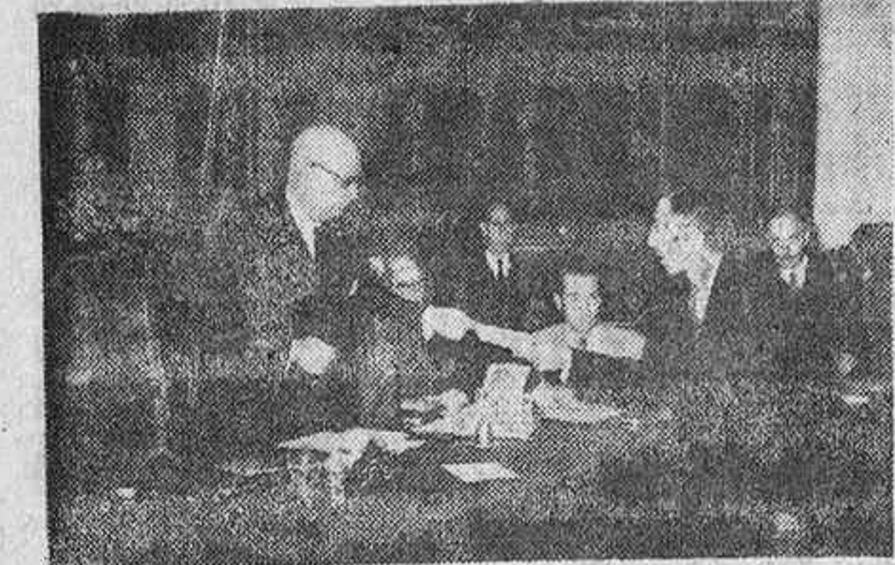
En el Ayuntamiento se verificó ayer el acto de entrega de sus credenciales a los candidatos a concejales...