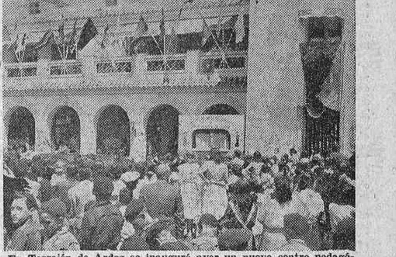
En Torrejón de Ardoz se inauguró ayer un nuevo centro pedagógico, creado por la Diputación Provincial de Madrid. La foto recoge un momento del acto inaugural, efectuado en el grupo escolar de la localidad.

FUE INAUGURADO AYER POR EL DIRECTOR DE PRIMERA ENSEÑANZA Y EL PRESIDENTE DE LA DIPUTACION