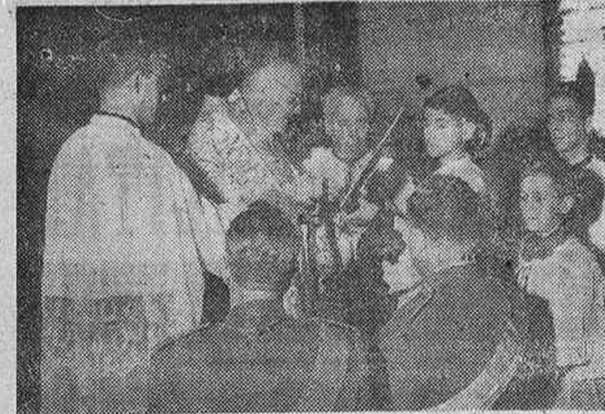
En la cripta de la Almudena se verificó ayer la bendición de la imagen de San Fernando e imposición de medallas a caballeros y damas de la Hermandad por el cardenal primado de España, doctor Fla y Deniel, a quien se ve en la foto durante un momento del solemne acto religioso.

BENDIJO UNA IMAGEN DEL REY SANTO EN LA CATEDRAL DE LA ALMUDENA