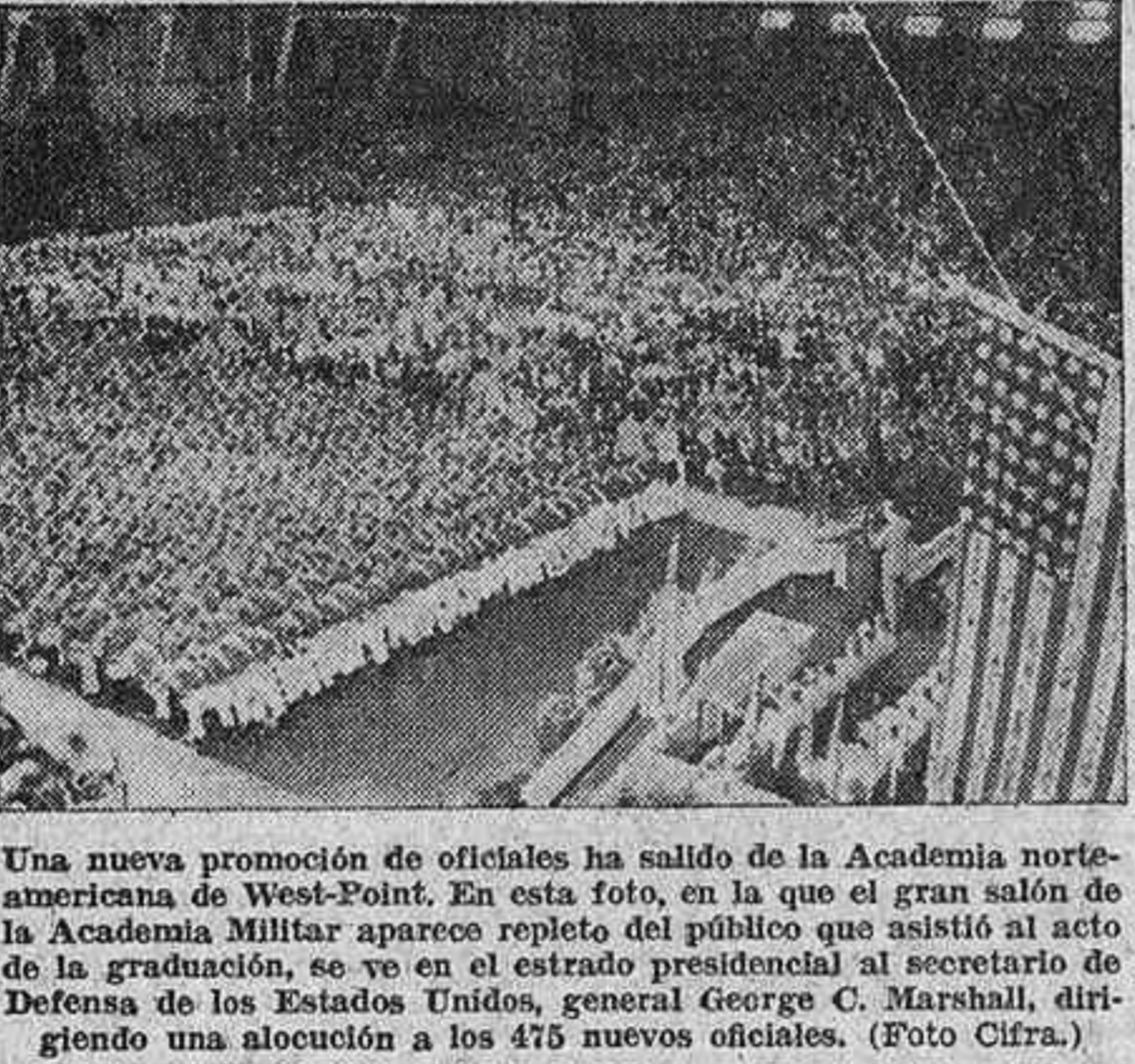
Una nueva promoción de oficiales ha salido de la Academia norteamericana de West-Point. En este foto, en la que el gran salón de la Academia Militar aparece repleto del público que asistió al acto de la graduación, se ve en el estrado presidencial al secretario de Defensa de los Estados Unidos, general George C. Marshall, dirigiendo una alocución a los 475 nuevos oficiales.