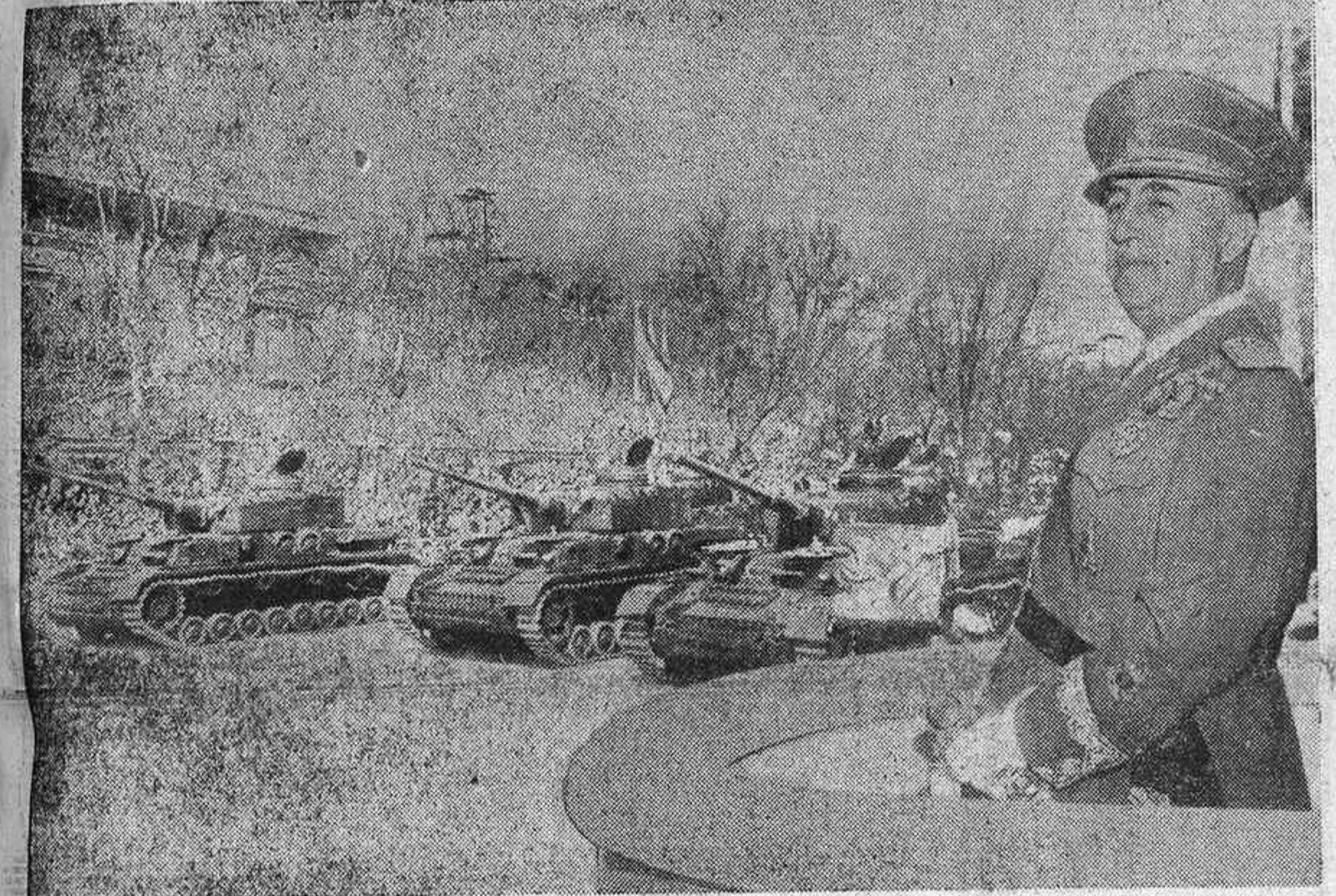
Su Excelencia el Jefe del Estado y Generalísimo Franco presenció a yer el desfile de las tropas, a las que un día supo llevar a gloriosa victoria, salvando a España de la terrible amenaza que sobre su destino se cernía. En la foto se ve al Caudillo en el momento de desfilar ante él, en la gran parada militar con que se conmemoró el XII aniversario de la histórica fecha del 1 de abril, a una columna de tanques de los que integran los diversos elementos combativos con que cuenta el moderno Ejército español.

Con la esposa y los hijos de Su Excelencia presenciaron la demostración todos los miembros del Cuerpo diplomático