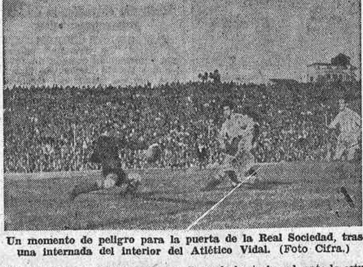
Un momento de peligro para la Real Sociedad, tras una internada del interior del delantero de la Real Sociedad, Víctor.