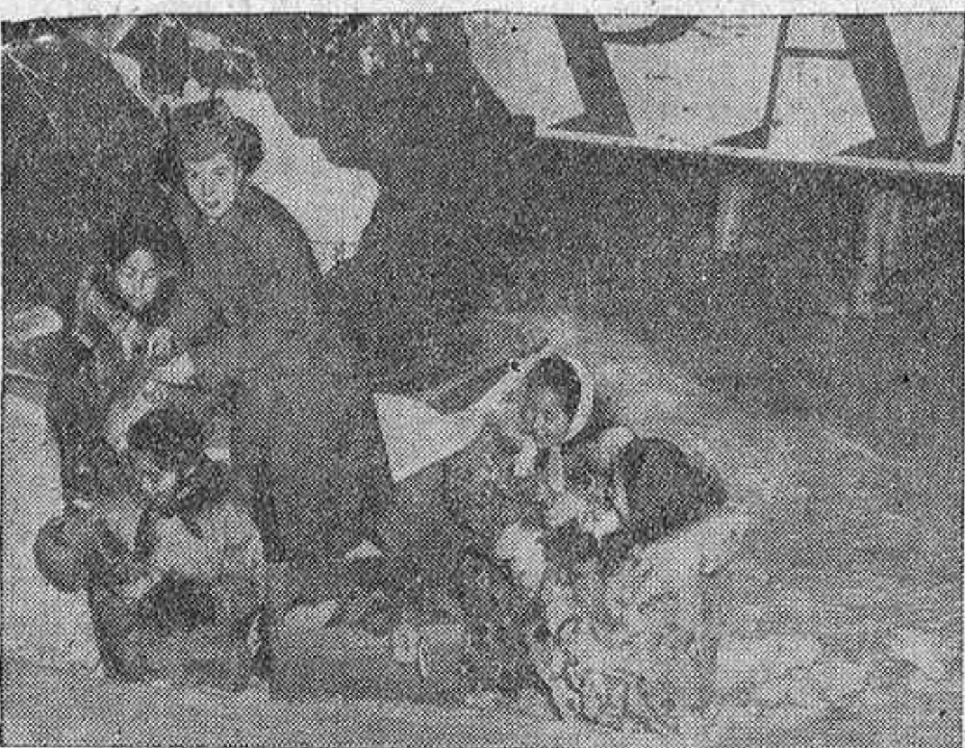
También a los habitantes de los Polos ha llegado este año, gracias a la aviación, el calor de las fiestas navideñas. He aquí a una señorita perteneciente a las líneas aéreas norteamericanas haciendo entrega de los regalos de Pascua a un grupo de pequeños esquimales de Fairbanks, en Alaska.

En Moscú. Cuatro mil de sus soldados se han entregado con uniformes rusos.