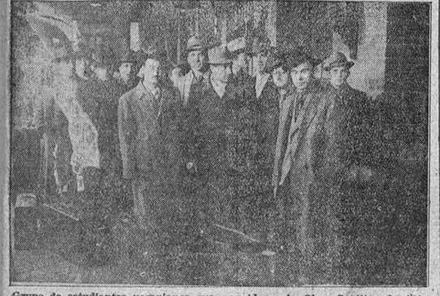
Grupo de estudiantes ucranianos que, acogidos a la Obra Católica de Asistencia Universitaria, llegaron ayer mañana a Madrid, donde proseguirán sus estudios.

Están acogidos a la Obra Católica española de Asistencia Universitaria. Proceden de campos de concentración de Italia, donde se refugiaron al huir del terror soviético