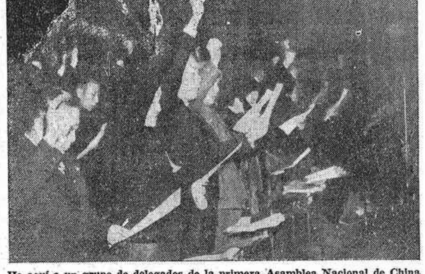
He aquí a un grupo de delegados de la primera Asamblea Nacional de China al tomar posesión de sus cargos. En primer término, a la izquierda, el doctor Sun Fo, hijo de Sun Yat Sen, fundador de la República; en el quinto lugar, la esposa de Chiang Kai Chek.

Prosigue con gran dureza la batalla en el sector de Yenán