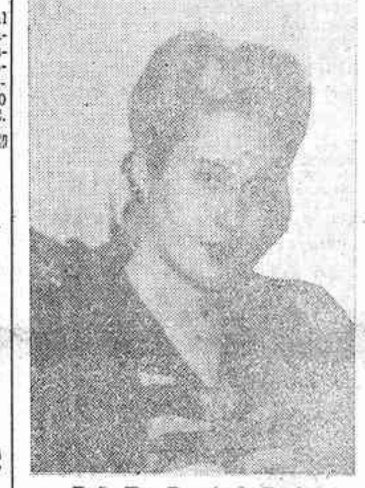
Doña Eva Duarte de Perón

TUCUMAN (Argentina), 1.—Los primeros informes facilitados por la Policía acerca del accidente ocurrido en esta ciudad con motivo de la llegada de la esposa del Presidente de la Argentina, Perón, arrojan la cifra de trece muertos y más de un centenar de heridos. Todos los actos que se habían preparado en homenaje a la señora de Perón han sido suspendidos por el duelo que reina en la ciudad. En la plaza de la Independencia debía ser proclamada Reina de Zafra, y al parecer, el suceso se produjo cuando algunos niños y ancianos se