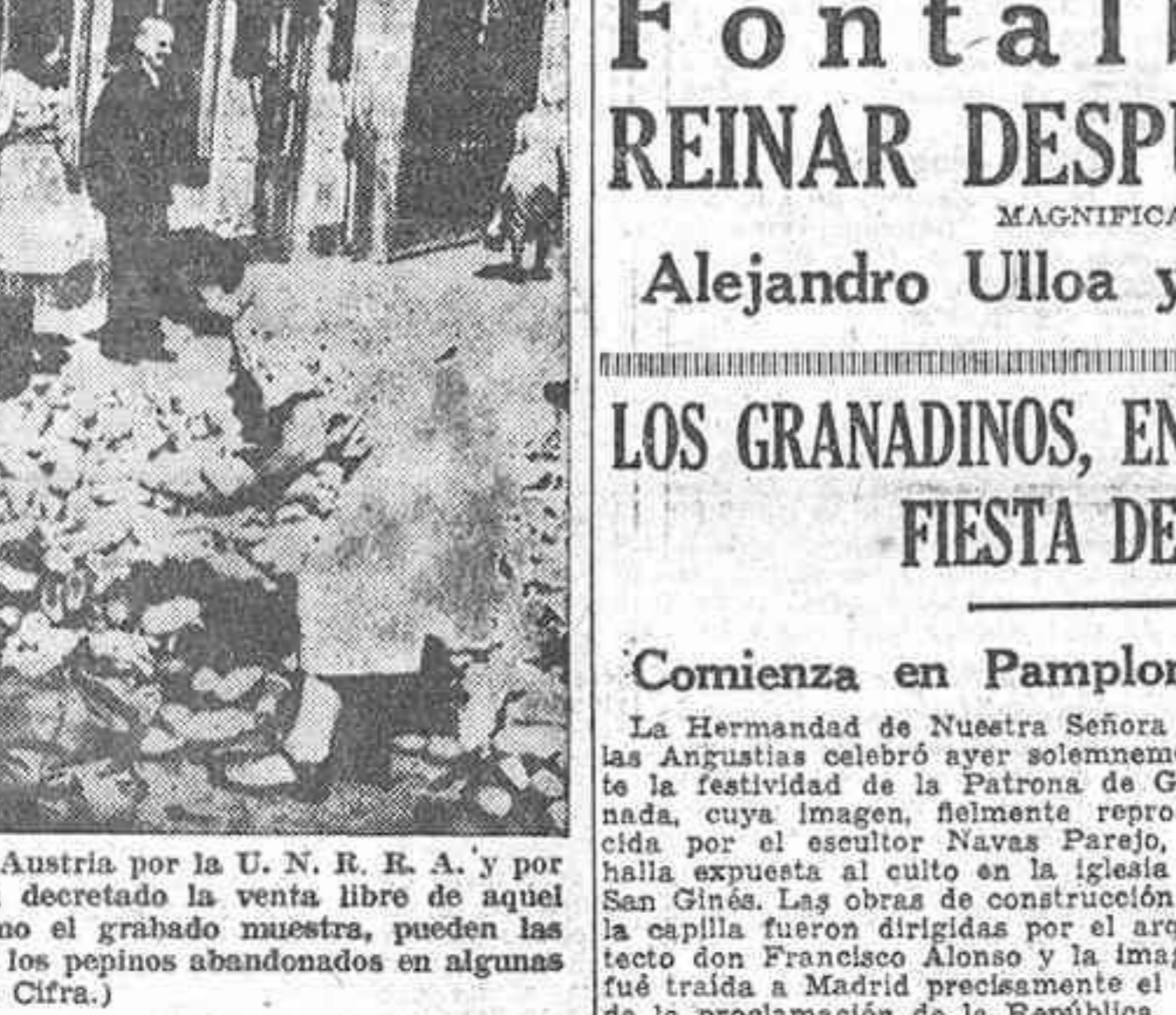
Es tal la cantidad de pepinos enviados a Austria por la U. N. R. R. A. y por Checoslovaquia, que las autoridades han decretado la venta libre de aquel artículo. Y aun sobran tantos, que, como el grabado muestra, pueden las mujeres vienesas llenar sus cachapos con los pepinos abandonados en algunas calles.