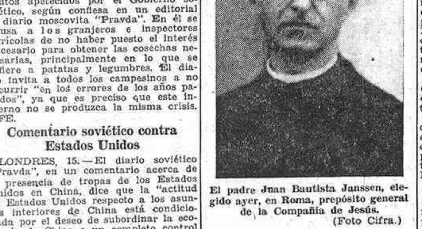
El padre Juan Bautista Janssens, elegido ayer, de Roma, preposito general de la Compañía de Jesús.

Fuó elegido el padre Janssens, provincial de Bélgica