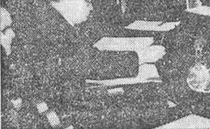
Las delegaciones británica y soviética en la Conferencia de Ministros de Asuntos Exteriores actualmente congregada en París, presidida por Mr. Ernest Bevin y Molotov, durante las discusiones preliminares del tratado de paz con Italia, que por la permanente intransigencia rusa siguen en punto muerto hasta la fecha.

SE BUSCA UNA FORMULA DE COMPROMISO EN PARIS