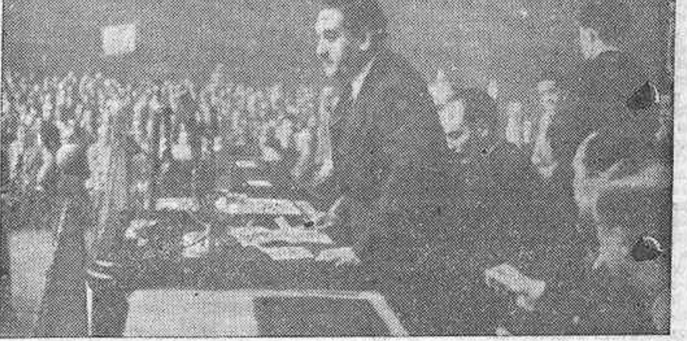
El subsecretario de Trabajo, señor Pinilla, durante el discurso que ayer pronunció en el gran acto sindical celebrado en el frontón Recoletos con motivo de la entrada en vigor de las nuevas bases de trabajo de la construcción.

Presidió, en medio de una enorme concurrencia, el subsecretario de Trabajo