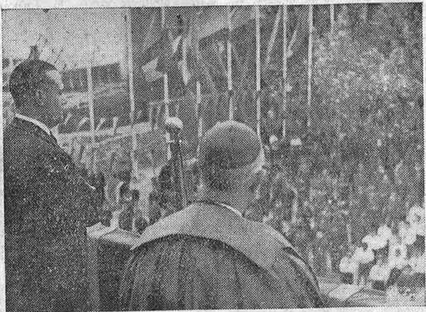
El alcalde, doctor Elio y Garay, y el ministro de la Gobernación, don Blas Pérez, presenciando los ejercicios físicos de los alumnos de las Escuelas Salesianas de Madrid durante la inauguración de los nuevos talleres de formación profesional.