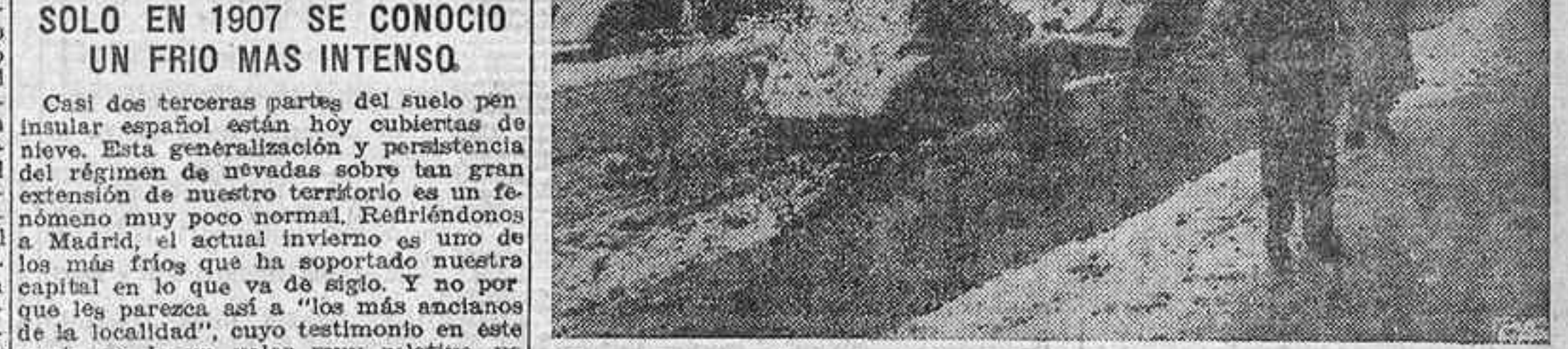
No aquí un aspecto de las calles de Madrid durante la nevada que se registró en la tarde de ayer, cuarta del actual invierno.