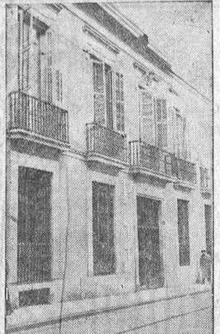
He aquí el exterior del viejo edificio de la calle madrileña de San Mateo en el que está instalado el Museo Romántico, y que, una vez terminadas las obras que se realizan en él, evocará un palacio señorial del primer tercio del siglo XIX.