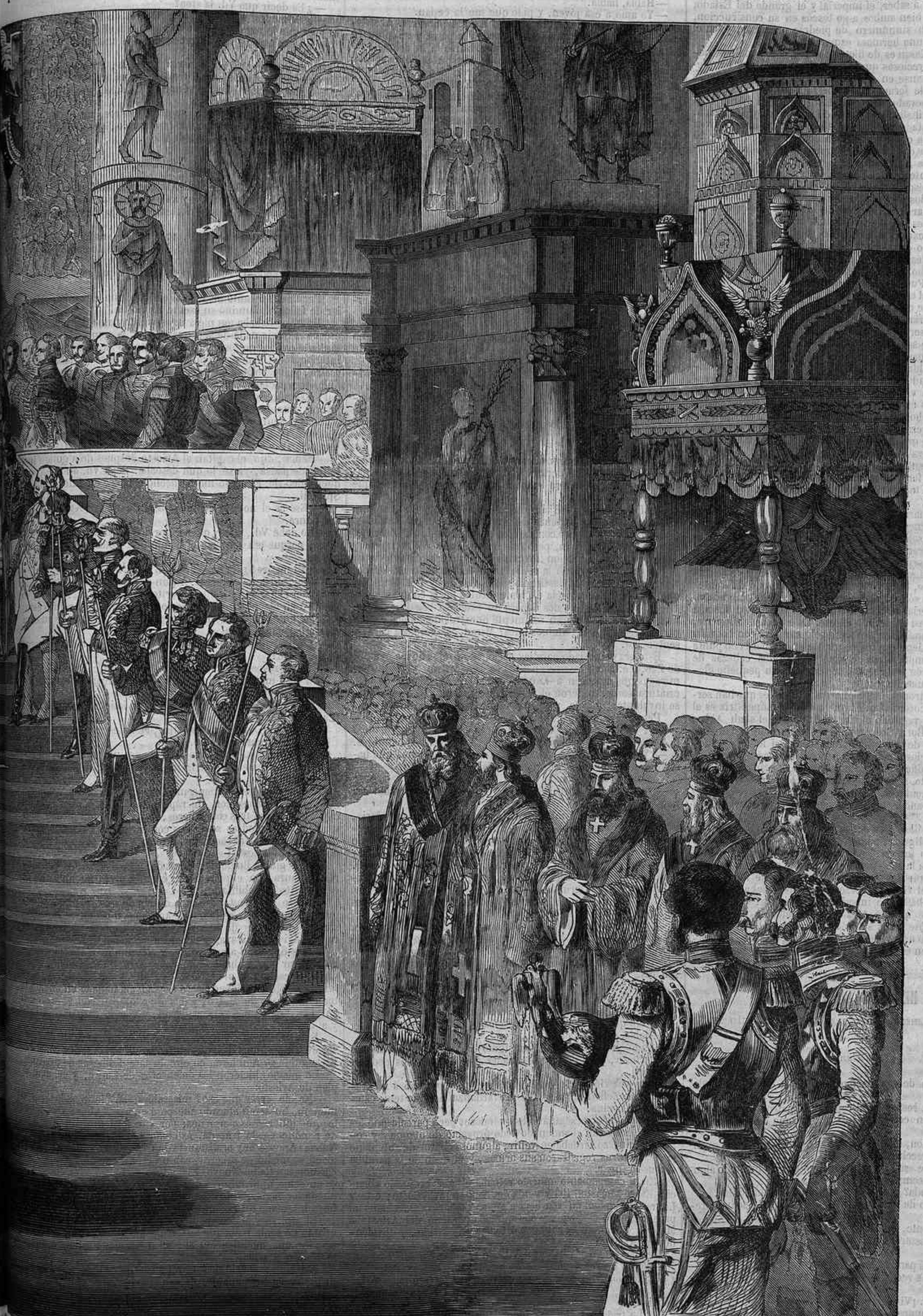
DEL EMPERADOR EN LA IGLESIA DE LA ASCENSION.

mas dimensiones, y 12 mas pequeñas de igual color. En la parte inferior se halla, como la anterior, guarnecida de piel. La corona de la Siberia es de oro macizo con adornos de