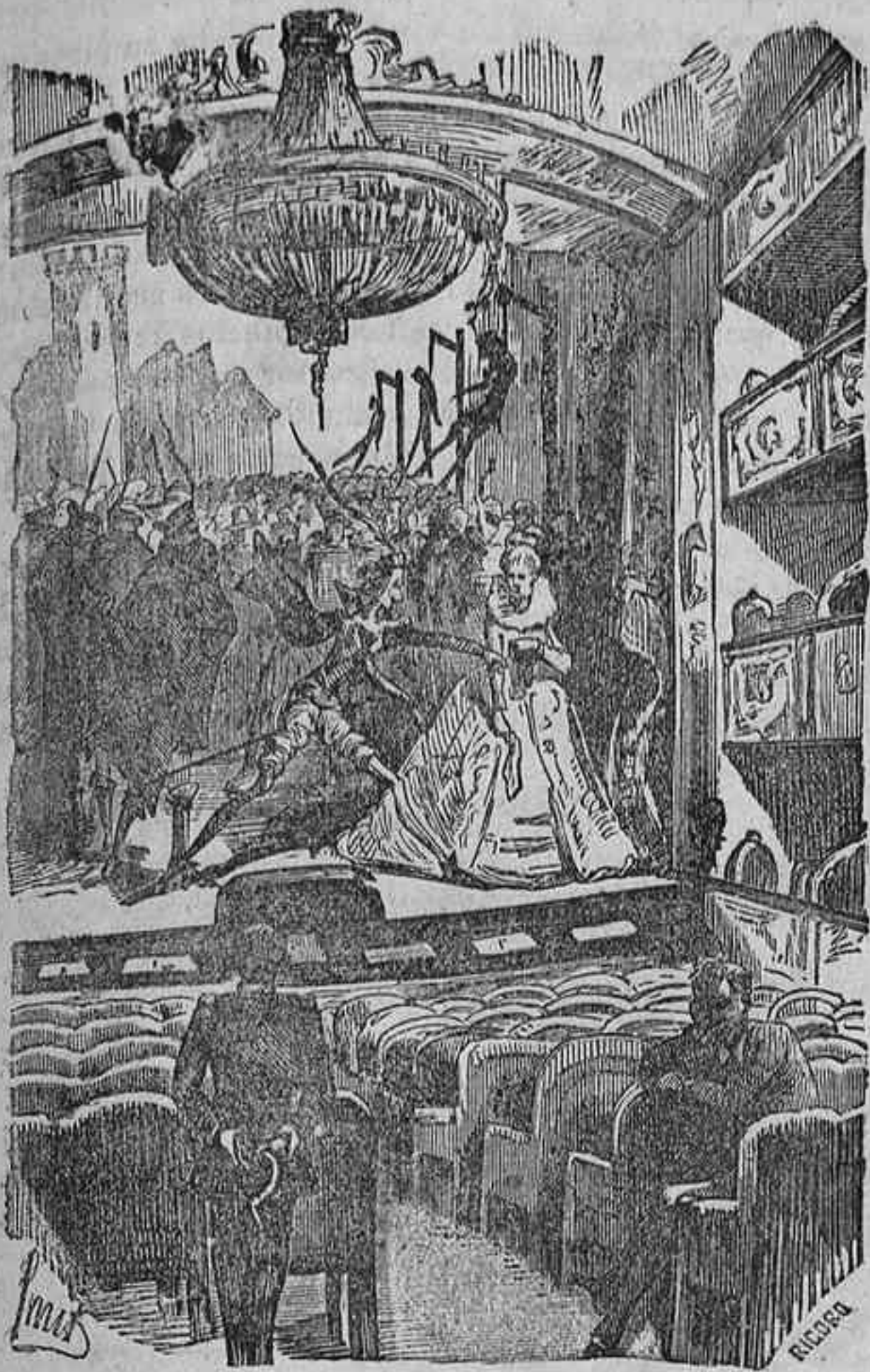
El público se afianza de tal manera al obsequio que, sin obsequio, un teatro parece ya un cementerio.

Si yo murmurar pudiera De los secretos que guardo, Avisos fueran mis ondas A mas de un enamorado.