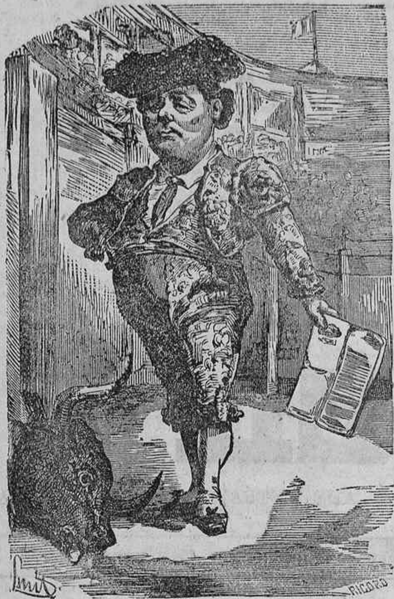
Cierta autoridad de Huesca mandó un oficio al maestro declarándole muy diestro, y el dijo: ¡Noticia fresca!

Voy á dar una solución, que ni es republicana ni monárquica.