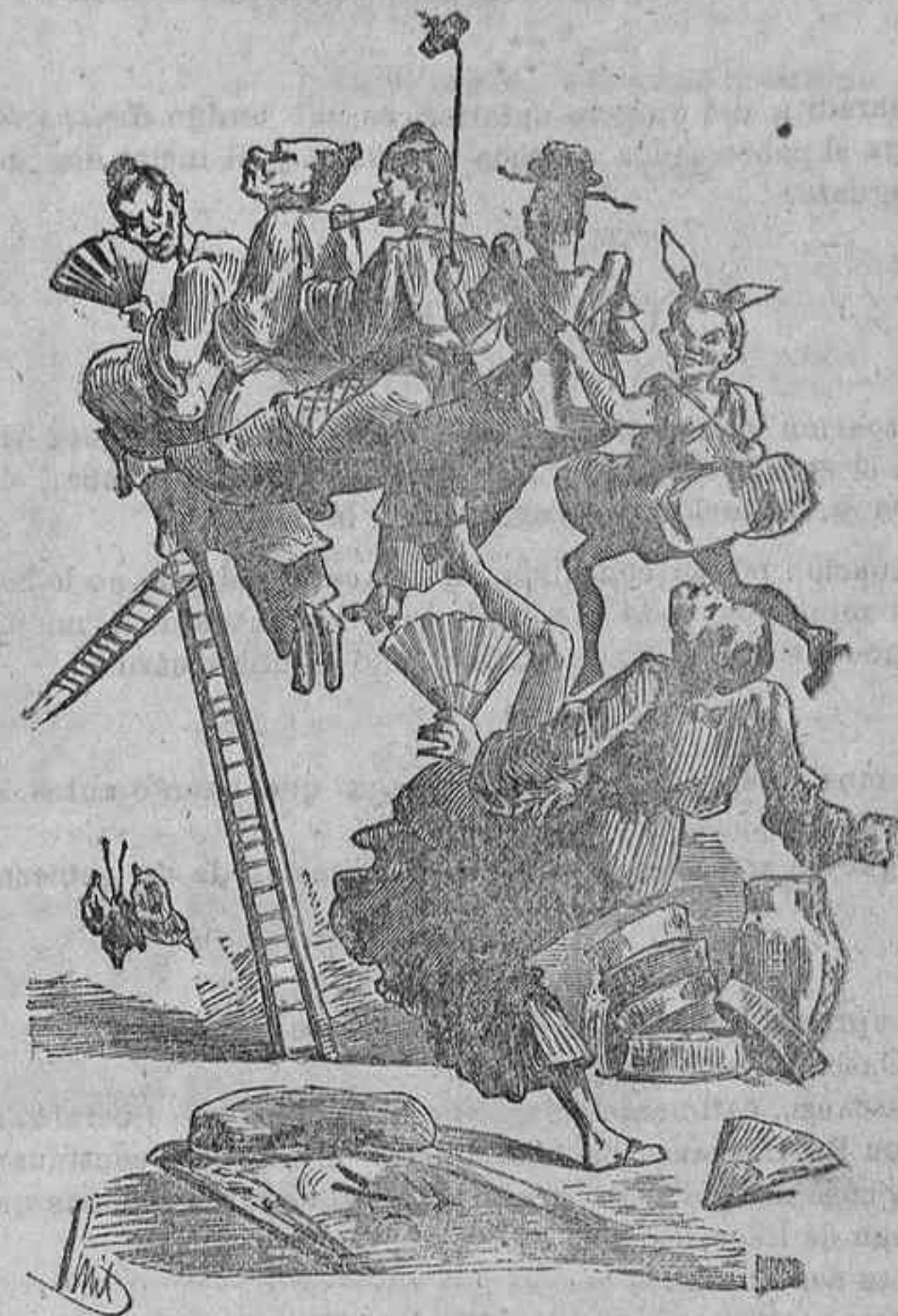
Los últimos moderados van á formar una empresa, para venir disfrazados de cuadrilla japonesa.

timo, ni me incomodo porque no me hacen embajador, ni quiero quitar á nadie su destino, ni voy á marear á ninguna persona con mis pretensiones.