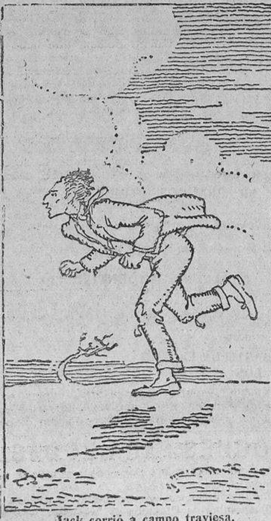
Jack corrió a campo traviesa.

—Oh, Jack, pero es horrible! —Horrible, no. Es maravilloso. Porque ¿qué importancia tiene el abandonar un mundo transitorio, un mundo en el que no logramos vivir sino unos pocos años, con tal de lograr otro mejor, en el que habitaremos eternamente, relacionados además con las almas que siguen en éste? ¿No ves la grandeza indescribible de la concepción? ¿Te das cuenta de la labor gigantesca de mi padre? ¿Qué significan todos los inventos alcanzados hasta aquí frente al invento de Tom Greenwood? ¿Todo es una miseria! Es más, mucho más que si se hubiera logrado la inmortalidad de los humanos, porque vivir siempre en el «pla-