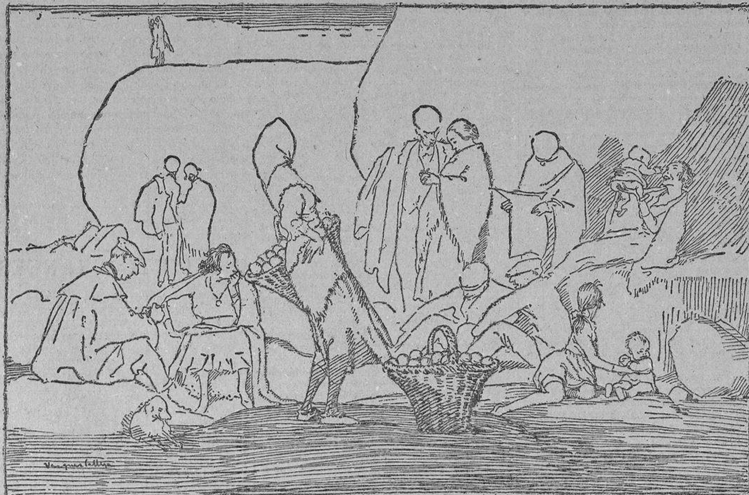
La hora de sol. ¡La naranjera, dulces!