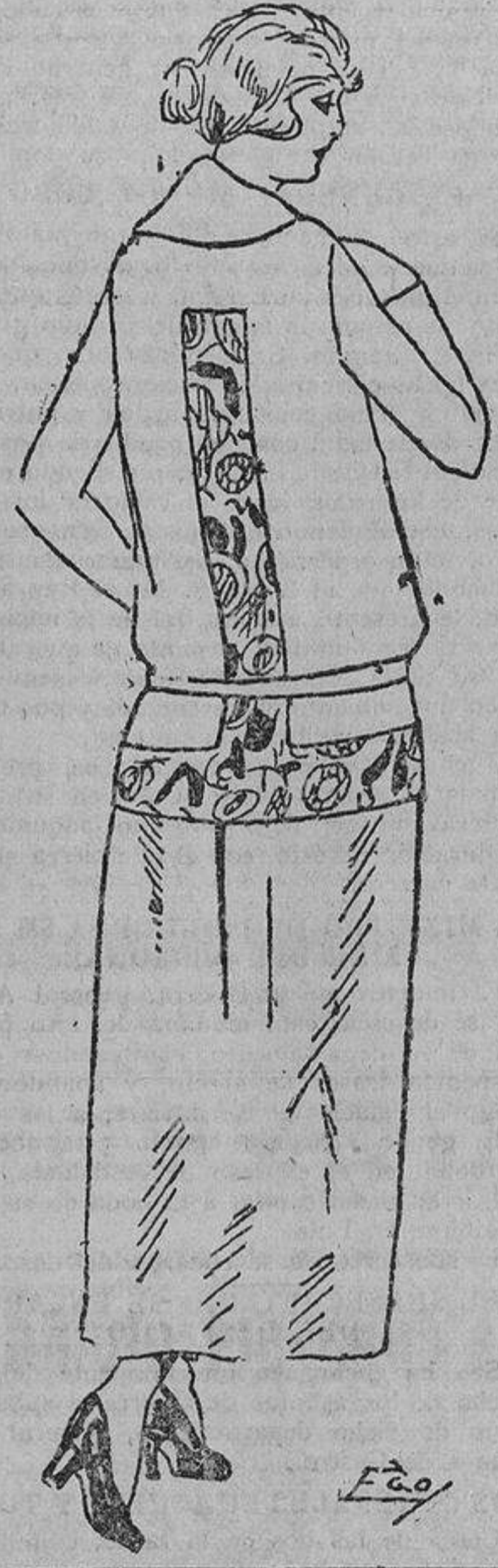
Para todas las consultas relacionadas con la sección de

El último está también confeccionado con seda y adornado con una escarapela al costado.