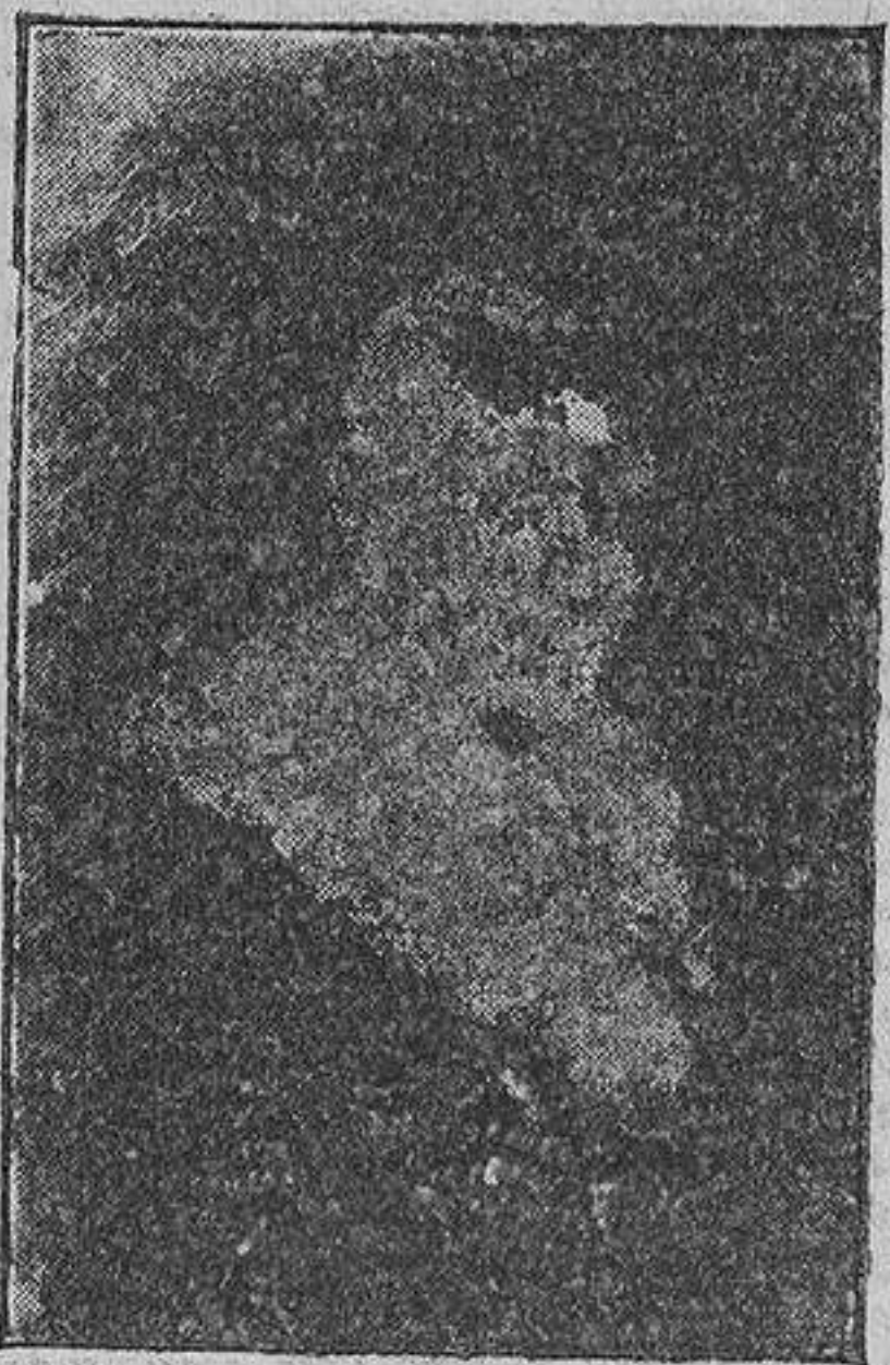
EXCMO. SR. D. CALIXTO VALVERDE RECTOR DE LA UNIVERSIDAD DE VALLADOLID

to es algo muy distinto de los fines perseguidos en la Conferencia imperial de Londres, en la que se ha buscado la unificación económica de la Gran Bretaña con sus colonias y dominios. La economía iberoamericana está indicada por las mismas condiciones reales actuales, no sólo históricas, entre España y América.