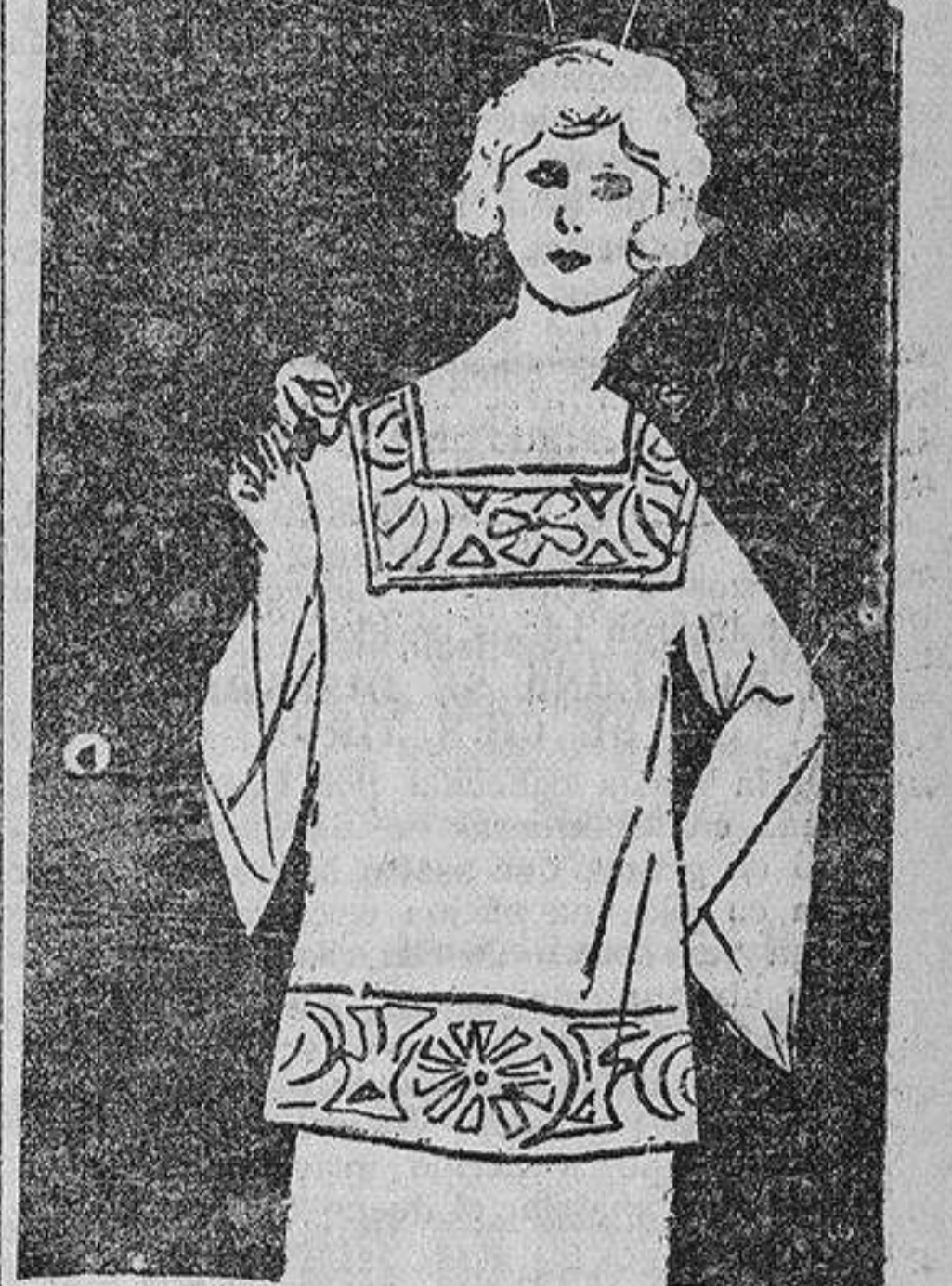
Elegante blusa de seda con bordados en colores.

Una cuarentona. —Para limpiar la dentadu-