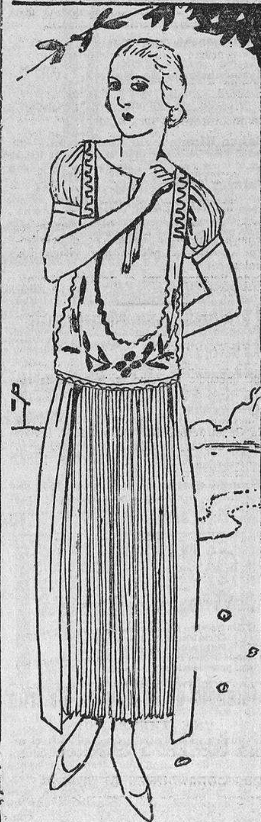
Vestido de crepón «amarrocan» blanco, adornado con crepé azul vivo y bordados en color. La falda plisada.

No se deben usar pendientes en las orejas. En cuanto termine de hablar, abandone la tribuna y siéntese.