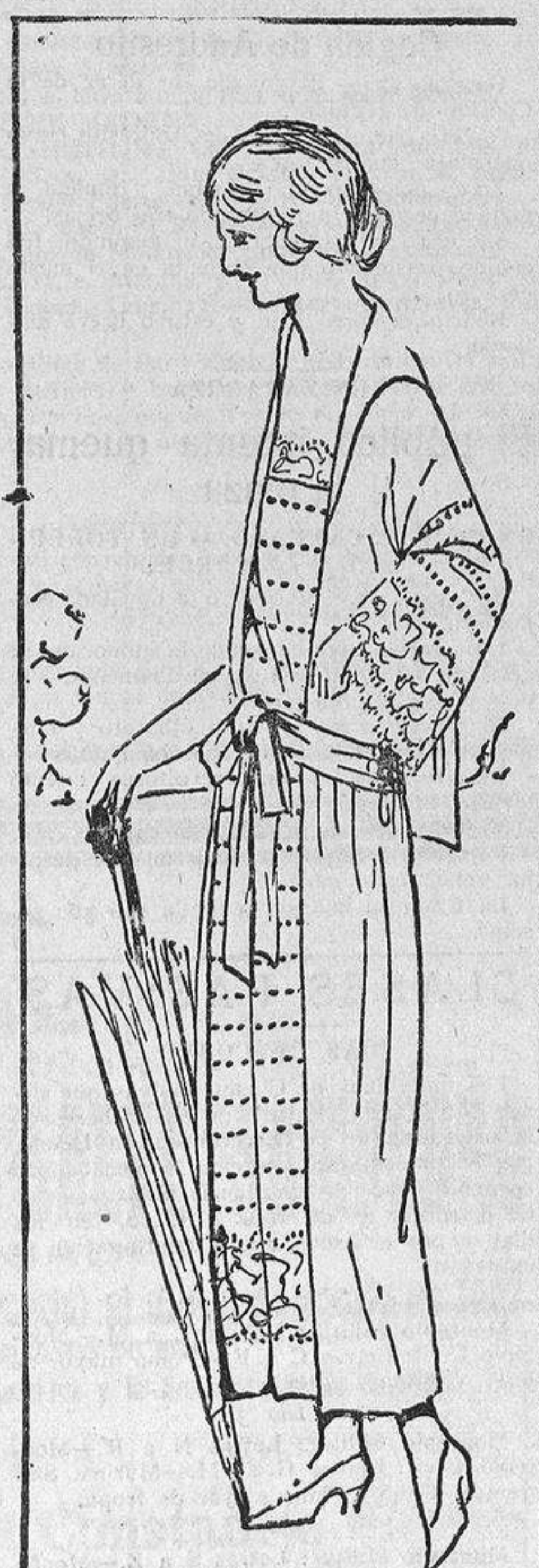
Vestido de crepón con las mangas y delanteros bordados en colores. Lleva una banda sujetando la cintura.

Acaso el procedimiento pueda parecer un poco caro, ya que para destilar el jugo necesario en una semana de baños se necesitarían alrededor de un par de toneladas de fresa y casi la misma cantidad de frambuesas.