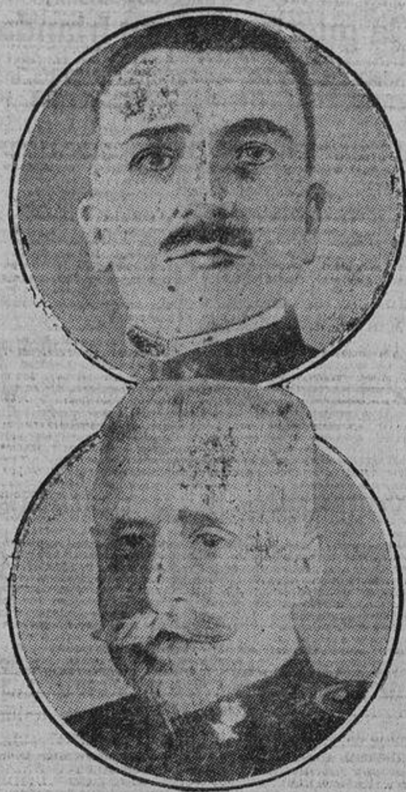
El general Díaz y el almirante Tahan de Revel, dos de los catorce ministros que forman el Gabinete fascista.