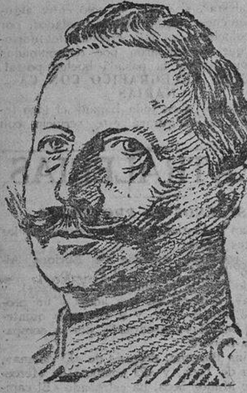
El Kaiser al estallar la guerra

Todas fueron conducidas a la Comisaría del distrito.