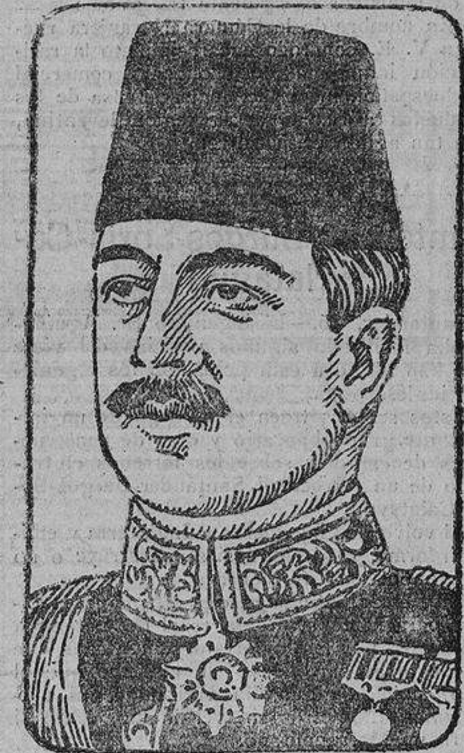
Noureddin pachá, que ha sido nombrado gobernador de Esmirna, ciudad ocupada por los turcos