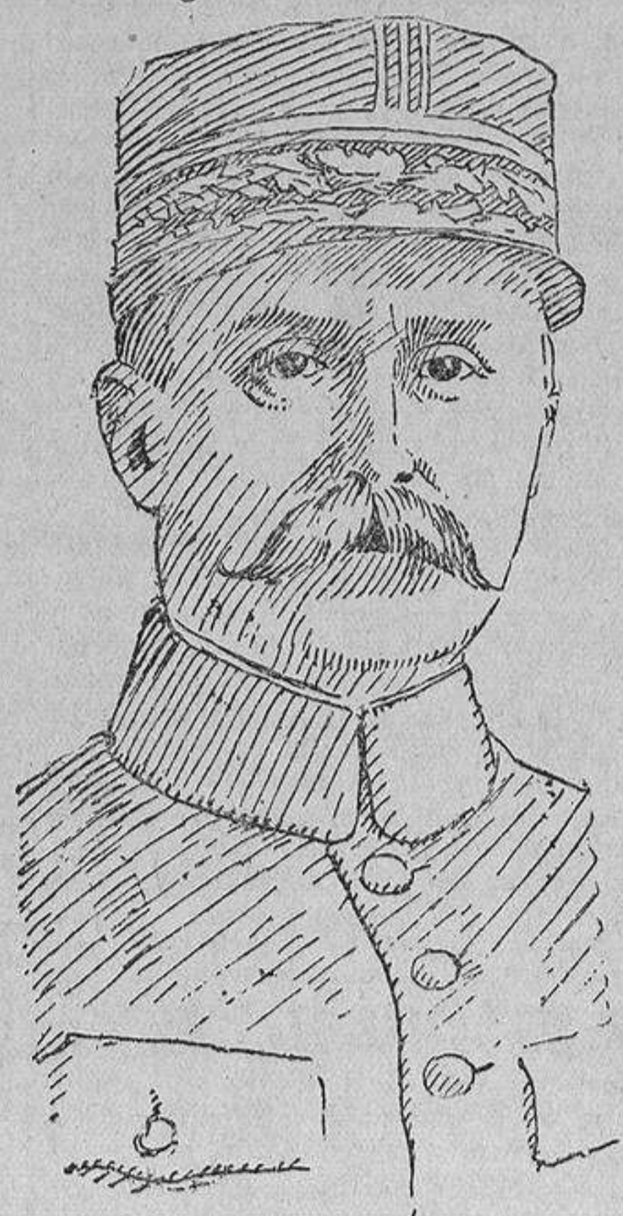
Petaín, general de los ejércitos franceses

Canciller y al ministerio de Negocios Extranjeros (Estado) en conflicto con el jefe del Estado Mayor, porque el general von Moltke era de parecer que la guerra estallaría irremisiblemente, mientras que los dos primeros seguían firmes en su opinión de que no se llegaría a esto; que la guerra se podría evitar, con tal de que yo no diese la orden de movilización. Esta disputa duró largo tiempo. Unicamente cuando el general Von Moltke dió parte de que los rusos habían establecido un cordón de tropas en la frontera, levantado los rails del