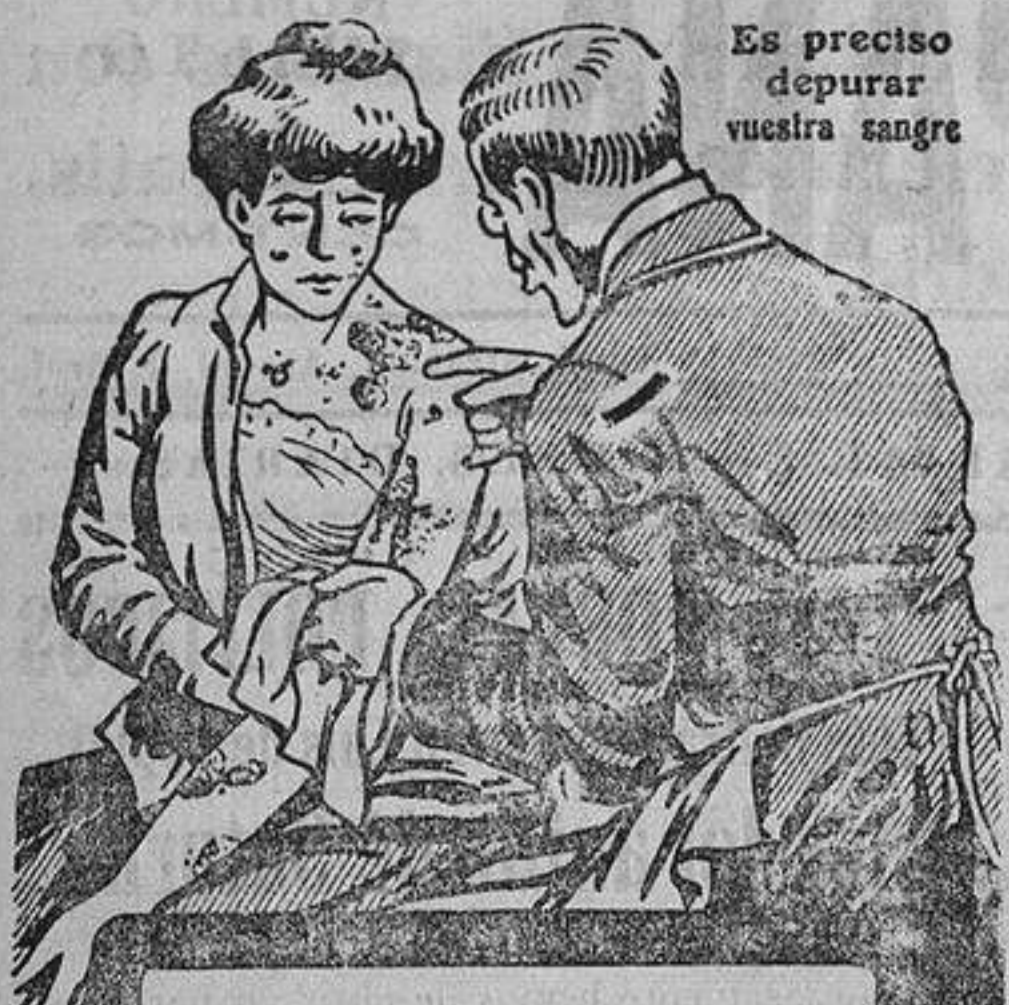
Es preciso depurar vuestra sangre