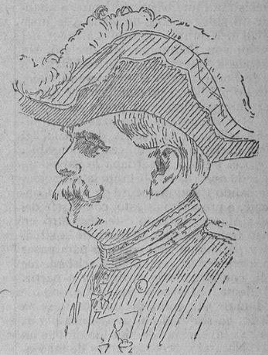
Joffre, mariscal de los ejércitos franceses

Con gran dolor de mi corazón dejé partir a este hombre tan activo como enérgico, que había llevado a cabo mis planes, siendo para mí un colaborador infatigable. De mi agradecimiento imperial puede es-