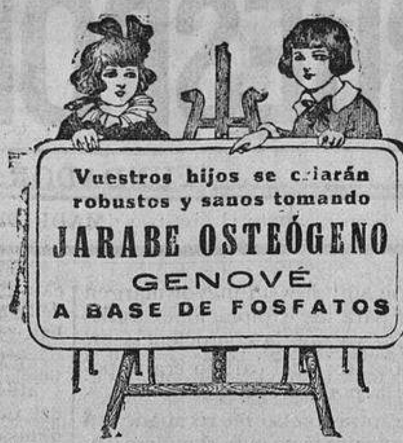
En todas las farmacias y centros de específicos

AVISO La casa que paga más por toda clase de alhajas, dentaduras, PAPELETAS DEL MONTE es Plaza Santa Cruz, 7. Platea. — Teléfono 772 M