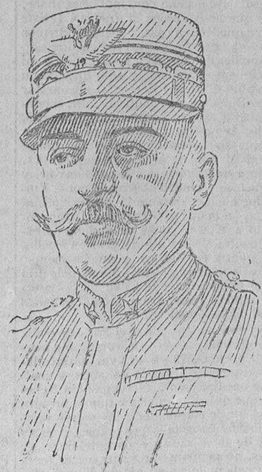
Cadorna, general en jefe de los ejércitos italianos

Séptima. Un ruso de elevado rango, miembro de la Duma, muy relacionado con Sasonow, me contaba más tarde datos del consejo secreto de la Corona celebrado bajo la presidencia del Zar en 1914, datos que me fueron confirmados por otras fuentes rusas que estaban anotadas en mis tablas históricas. En este Consejo de la Corona hizo Sasonow un informe, en el que propuso al Zar tomara Constantinopla. Como quiera que la Triple no accedería a