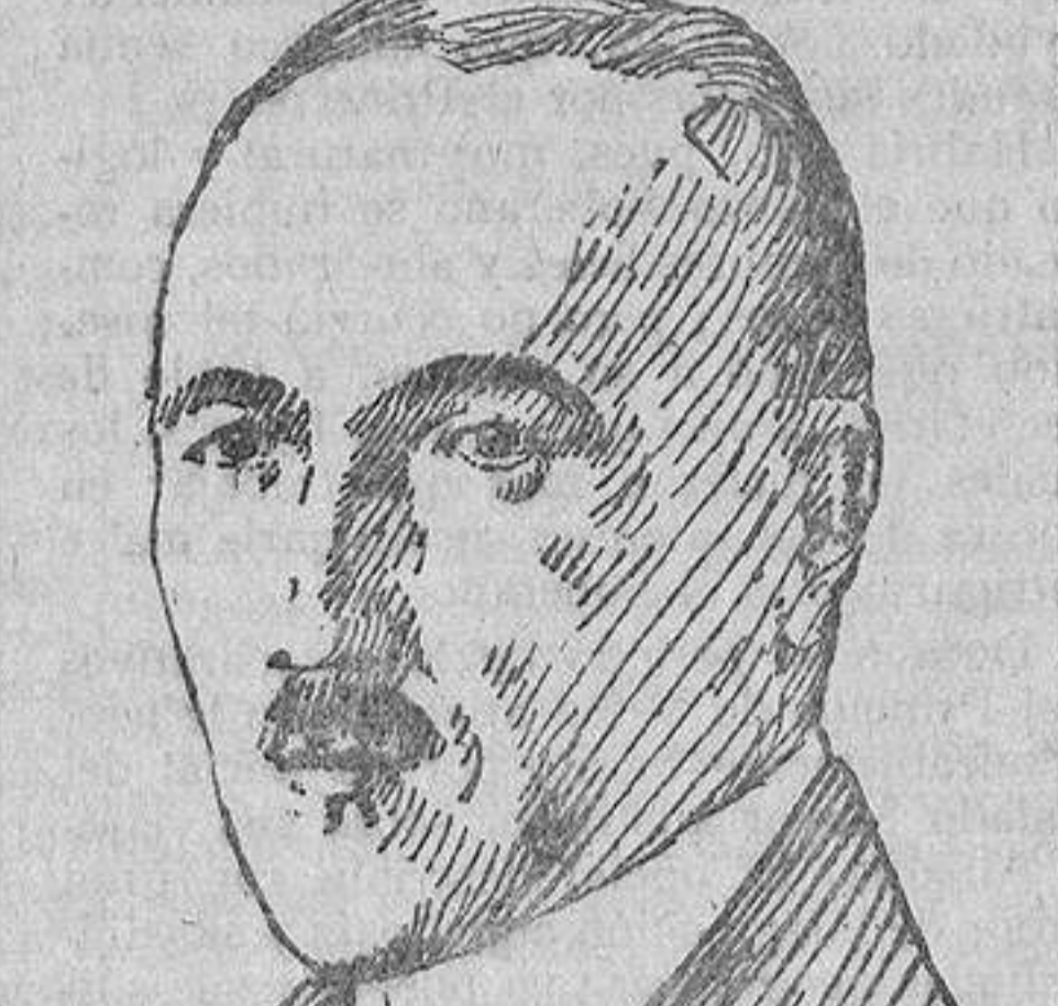
Herr von Jagow, ministro alemán de Negocios Extranjeros.

Por aquel tiempo se hablaba de la necesidad de constituir un Estado albanés independiente, y me interesé en la participación que las Potencias habrían de tener en la elección de un Soberano para el nuevo Estado. Ya se habían presentado al acérrago de Potencias varios candidatos al Trono, que no habían sido aceptados, y otros, propuestos por las naciones, fueron rechazados por los albaneses. Yo creía que, como en toda «formación de un nuevo Estado», era preciso, sobre todo, tener en cuenta su proceso histórico, sus