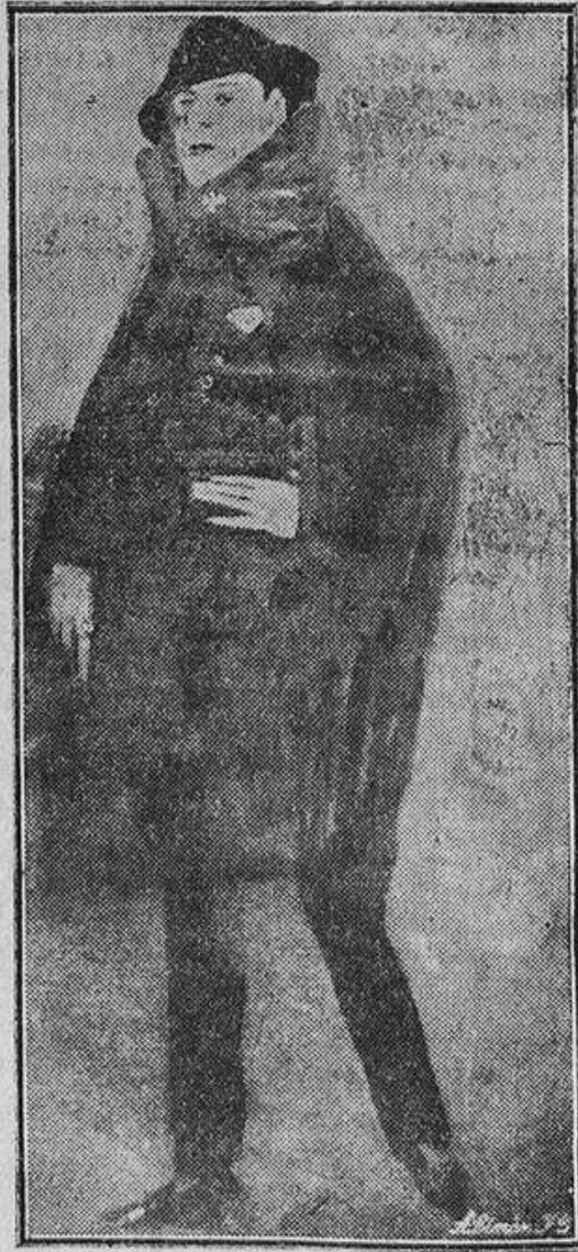
Antonio de Hoyos, según un cuadro de Federico Beltrán.

El empleado nos acompañó a la escalera del Metro recayente a la calle del Conde de Romanones, cuya entrada está dentro de los jardillos de la plaza del Progreso, y en efecto, allí pudimos aún ver algunos escalones recién lavados, y en el último de ellos, el que enlaza con el primer rellano, huellas aún de sangre, que por haberse resacado el agua vertida sobre ella, no pudo del todo borrar.