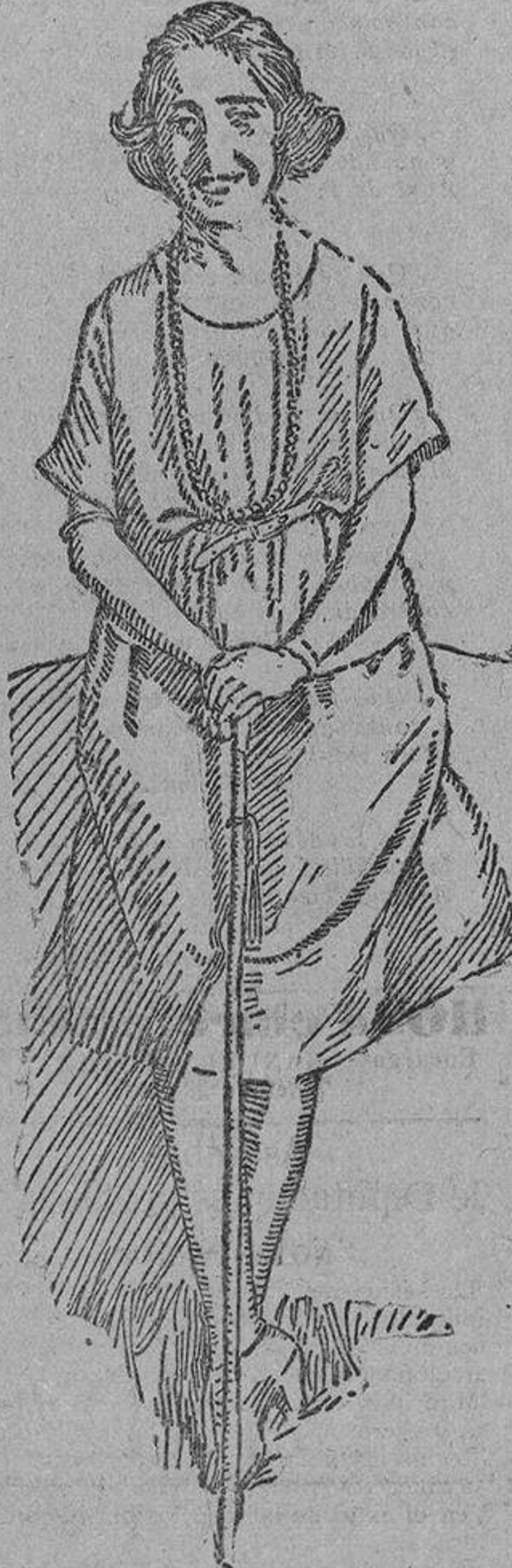
Señorita...o, distinguida y hábil alpinista.

No. Para el pendiente encuentro con Francia, «donde nos dijeron que nos enseñarían a jugar al 'foot-ball' se precisa que vaya lo mejor de casa.