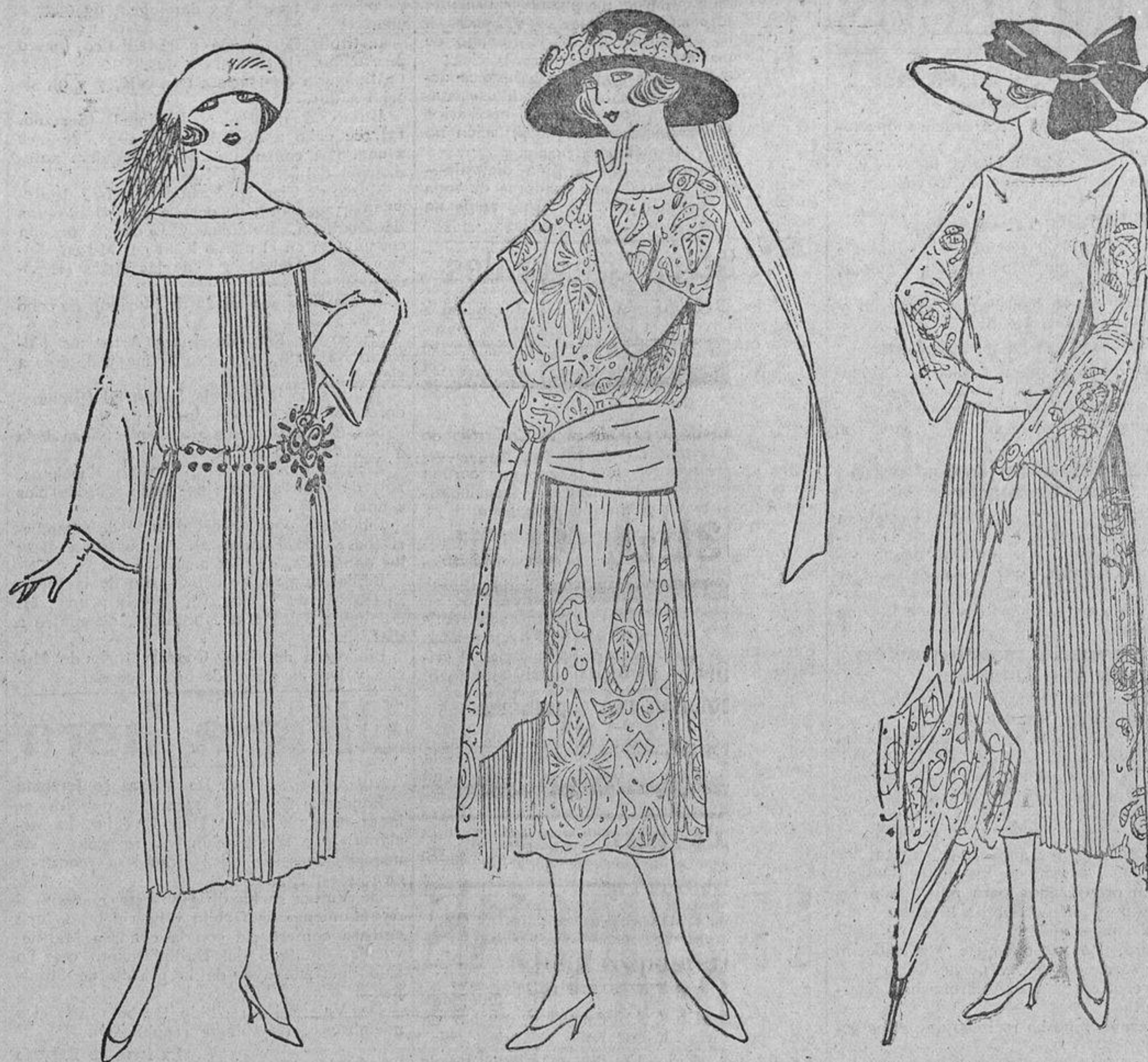
El arquetipo de la sencillez es este vestido de crespón blanco, plisado y liso a trozos.