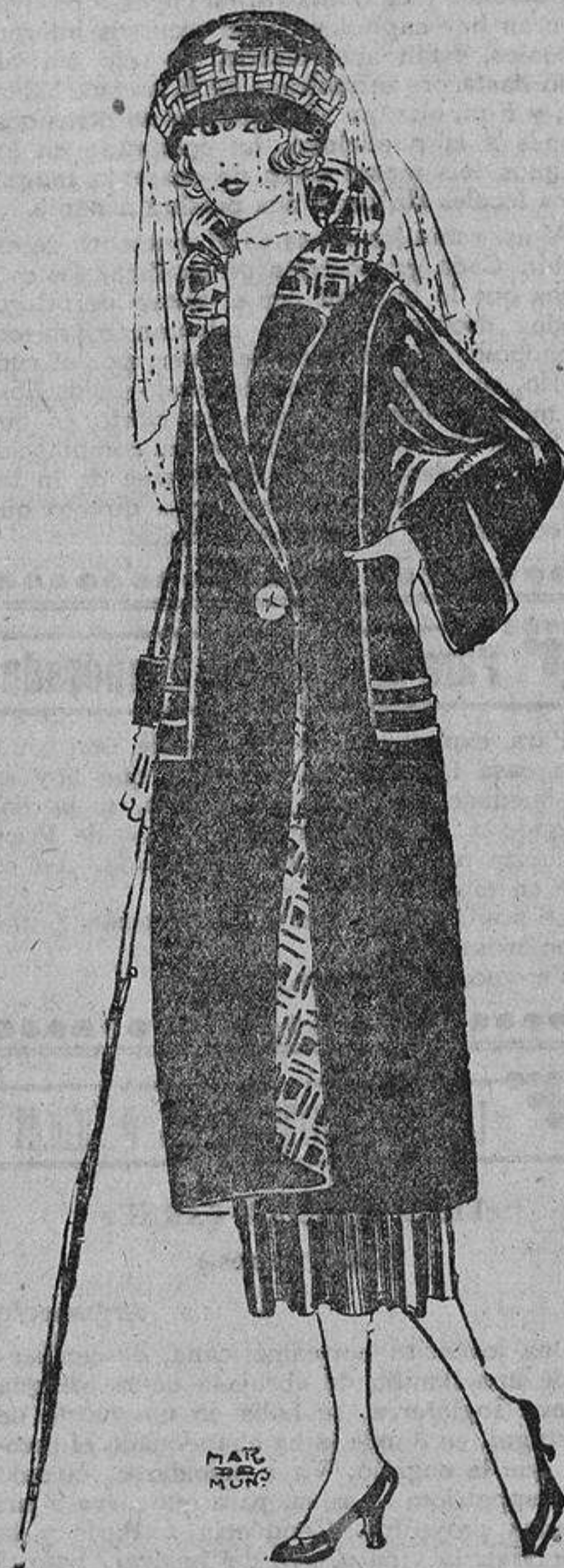
Apenas se levanta una ligera brisa, la elegante aprovecha la ocasión de lucir su abrigo de gabardina azul marino adornado con vivos de cabrilla blanca y enteramente forrado con el mismo «foulard» del vestido.

Pedido al editor J. SPINELLI PRECIADOS, 7.-MADRID