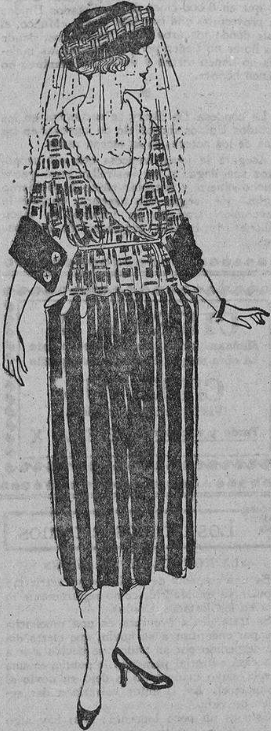
El «foulard» ha sido proclamado el «as» de los tejidos para este verano; por eso una elegante debe tener en su guardarropa por lo menos uno que bien puede ser como este azul marino liso, combinado con «foulard» blanco estampado en marino.

Estos días en que tan ocupadas estamos en la elección de nuestras «toilettes», son de gran ajeteo, y sobre todo aparentamos